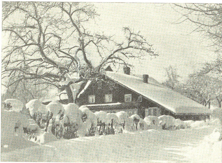
St. Gallisches Bauernhaus an der Gerhalde im Winter.