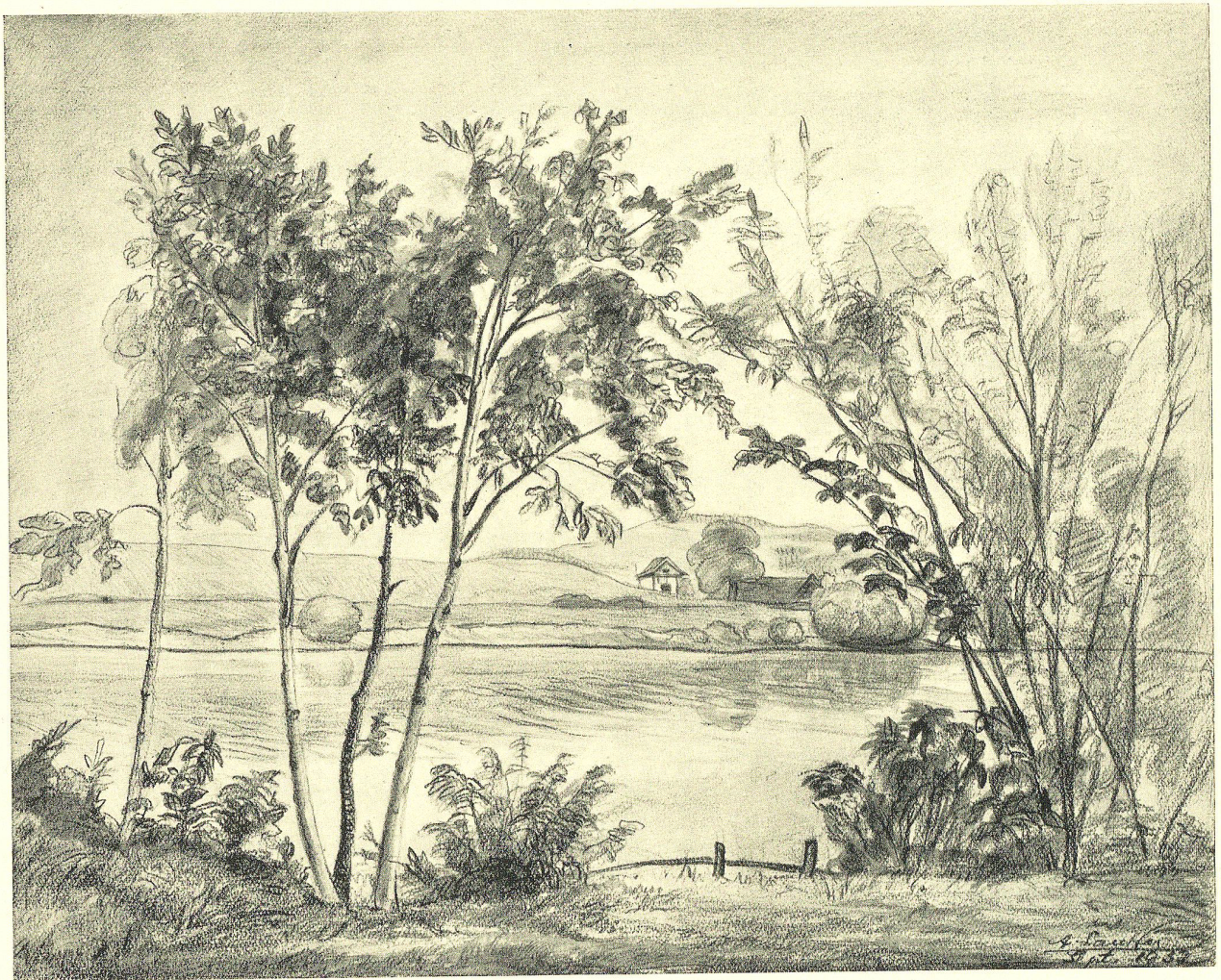
Am Gübsensee Bleistiftzeichnung von A. Lauffer, Herisau