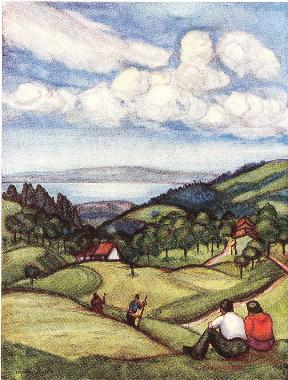
Aus St. Gallens Umgebung Nach einem Aquarell von Willy Thaler