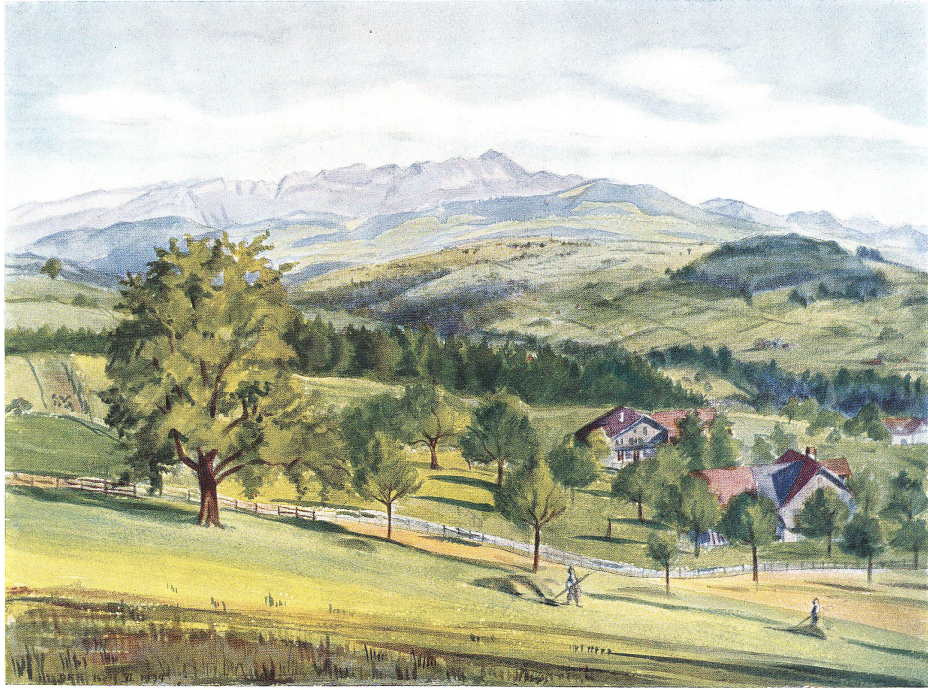
Blick auf die Säntiskette von der Menzelnhöhe aus Nach einem Aquarell von Dora F. Rittmeyer

Vierfarbenbuchdruck der Buchdruckerei Zollikofer & Co., St. Gallen