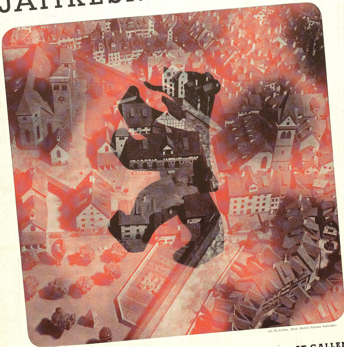
Alt St. Gallen. Nach Modell Salomo Schlatter.

DRUCK UND VERLAG BUCHDRUCKEREI ZOLLIKOFER & CO. ST. GALLEN