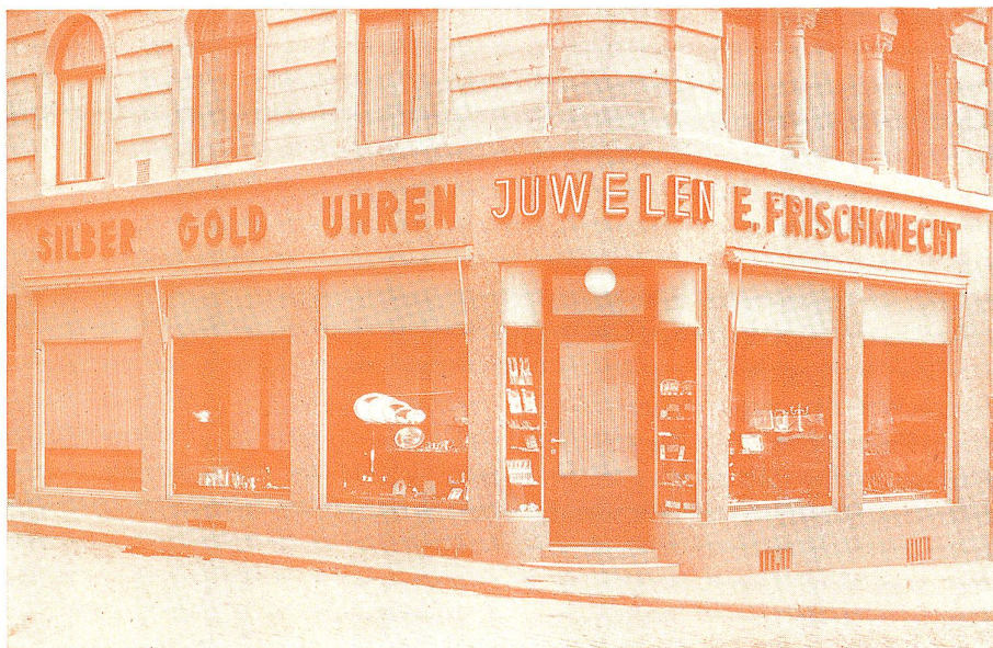
Leistungsfähigste Werkstätte am Platze

Etwas Geheimnisvolles hat von jeher das Wünschelrutenproblem umgeben und seine Verbindung mit Aberglauben und allerlei Unsinn begünstigt. Daher kommt es, daß einzelne Vertreter der strengen Wissenschaft das Kind mit dem Bade ausschütten und alles als Irrtum und Täuschung bezeichnen, während auf der Seite der Rutengänger der Fehler gemacht wird, Zufallserfolge und solche, bei welchen die Möglichkeit suggestiver Täuschungen zu wenig berücksichtigt wurde, als Tatsachen und Beweise leidenschaftlich zu verteidigen. — Wie steht es nun aber eigentlich mit der Realität all dieser Erscheinungen und mit den Möglichkeiten, sie physikalisch erklären zu können? Denn wenn Einwirkungen des Untergrundes auf unsern Organismus oder ganz allgemein auf Lebewesen vorhanden sind, dann müssen sie letzten Endes durch physikalische Vorgänge, z. B. Strahlen irgendwelcher Art, übertragen oder durch besondere physikalische Zustände des Raumes bedingt sein. Daß Strahlen auf unsern Organismus einwirken können, braucht nicht weiter erläutert zu werden; wir müssen nur an Sonnen-, Röntgen- oder Radiumstrahlen denken, welche alle ebensowohl als wertvolle Heilfaktoren