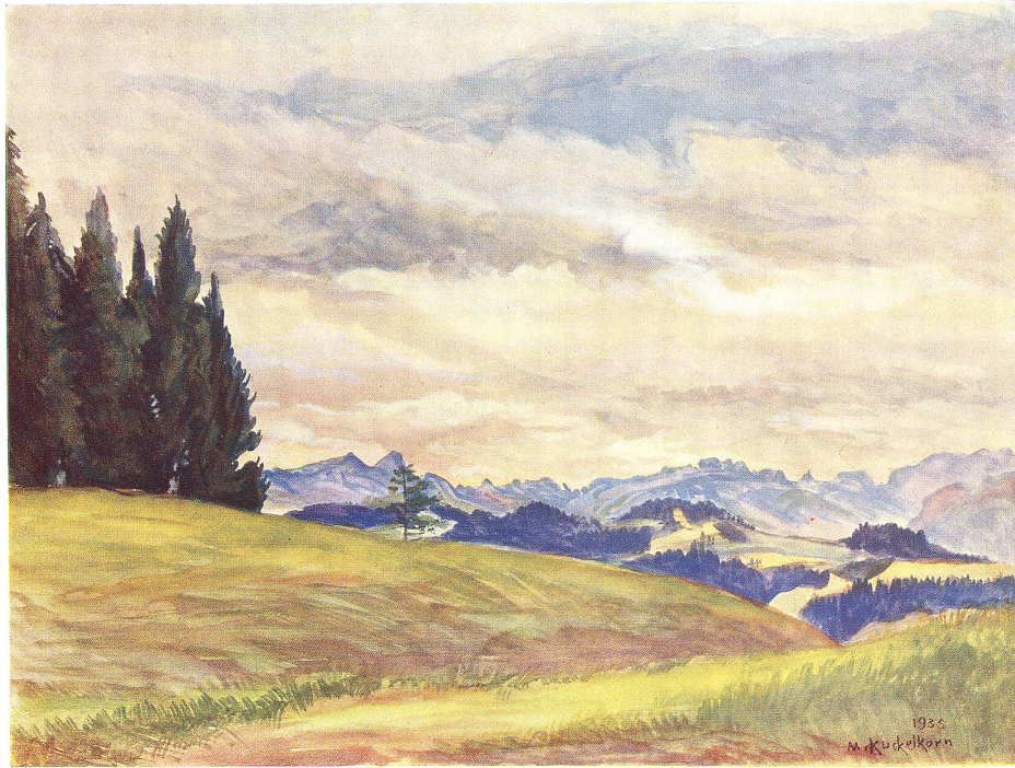
Blick von der Äußern Egg auf den Alpstein