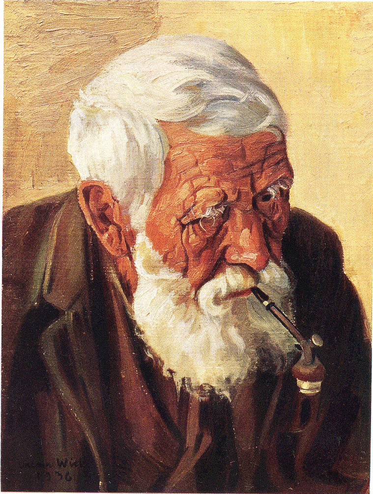
Studienkopf. Nach einem Gemälde von H. Wick

Dreifarbendruck von Zollikofer & Co., Buchdruckerei, St. Gallen