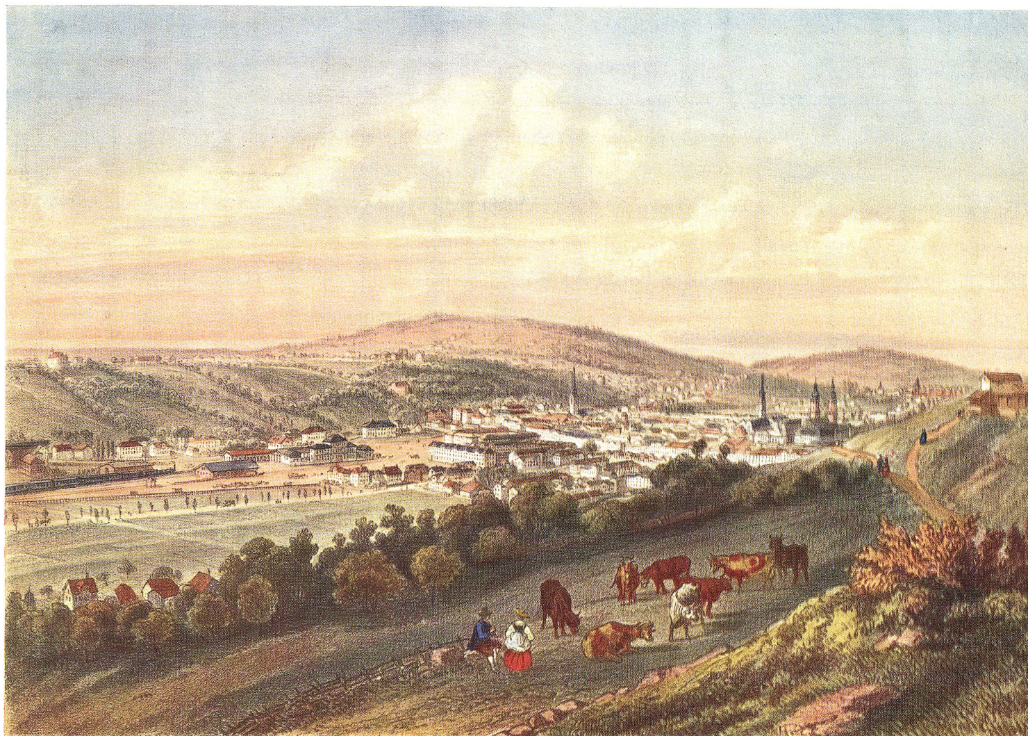
Die Stadt St. Gallen zur Zeit der Gründung der Helvetia-Gesellschaften