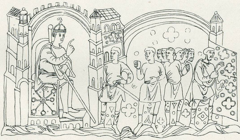
Der thronende David und seine Heerführer (Aus dem Psalterium aureum, 9. Jahrhundert, Stiftsbibliothek St.Gallen)

Die berühmtesten Namen des Klosters und seiner Schule in mittelalterlicher Zeit sind Notker und Ekkehart. Es handelt sich aber bei diesen Namen nicht nur um zwei Mönche, sondern um eine ganze Reihe von gelehrten Persönlichkeiten, die einen dieser Namen trugen. Ekkehart I., der im Jahre 973 starb, ist der Dichter des „Waltherliedes“, das in lateinischen Versen alte deutsche Sagen erzählt. Joseph Viktor von Scheffel hat dieses Werk in deutscher Sprache nachgedichtet und es seinem berühmten Roman „Ekkehart“ eingefügt. In diesem Roman hat sich der Dichter die poetische Freiheit erlaubt, den ersten und den zweiten Ekkehart als eine einzige Persönlichkeit darzustellen. Ekkehart II. war es nämlich, der als Lehrer in der inneren und äußeren Klosterschule amtierte und im Jahre 973 von der Herzogin Hadwig, der Witwe Burkharths II. von Schwaben, als Lateinlehrer auf dem Hohentwiel lebte.