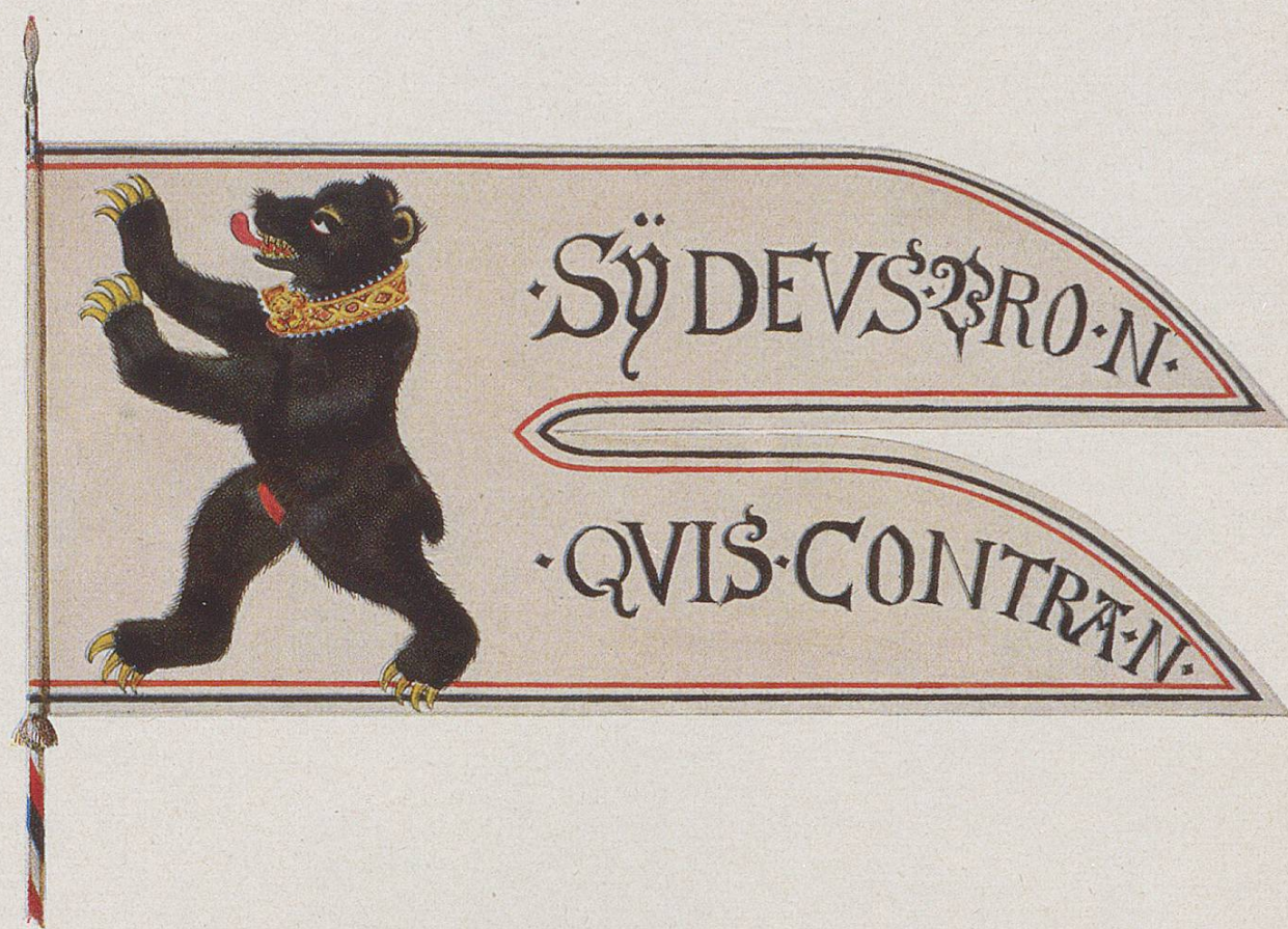
Standarte einer Reiterformation der Stadt St.Gallen, zweite Hälfte des 16. Jahrhunderts (St.Gallen, Historisches Museum)