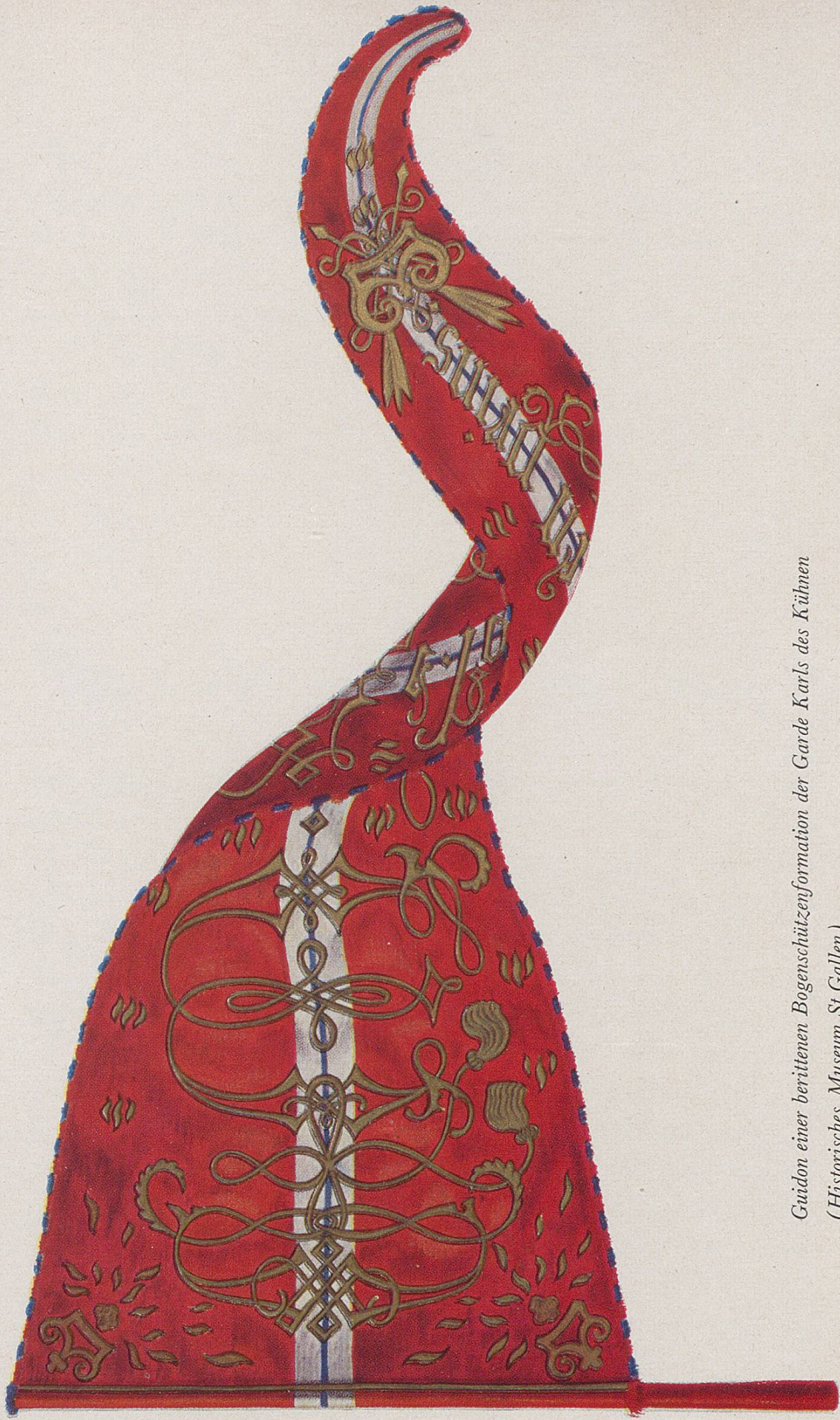
Guidon einer berittenen Bogenschützenformation der Garde Karls des Kühnen (Historisches Museum St.Gallen)