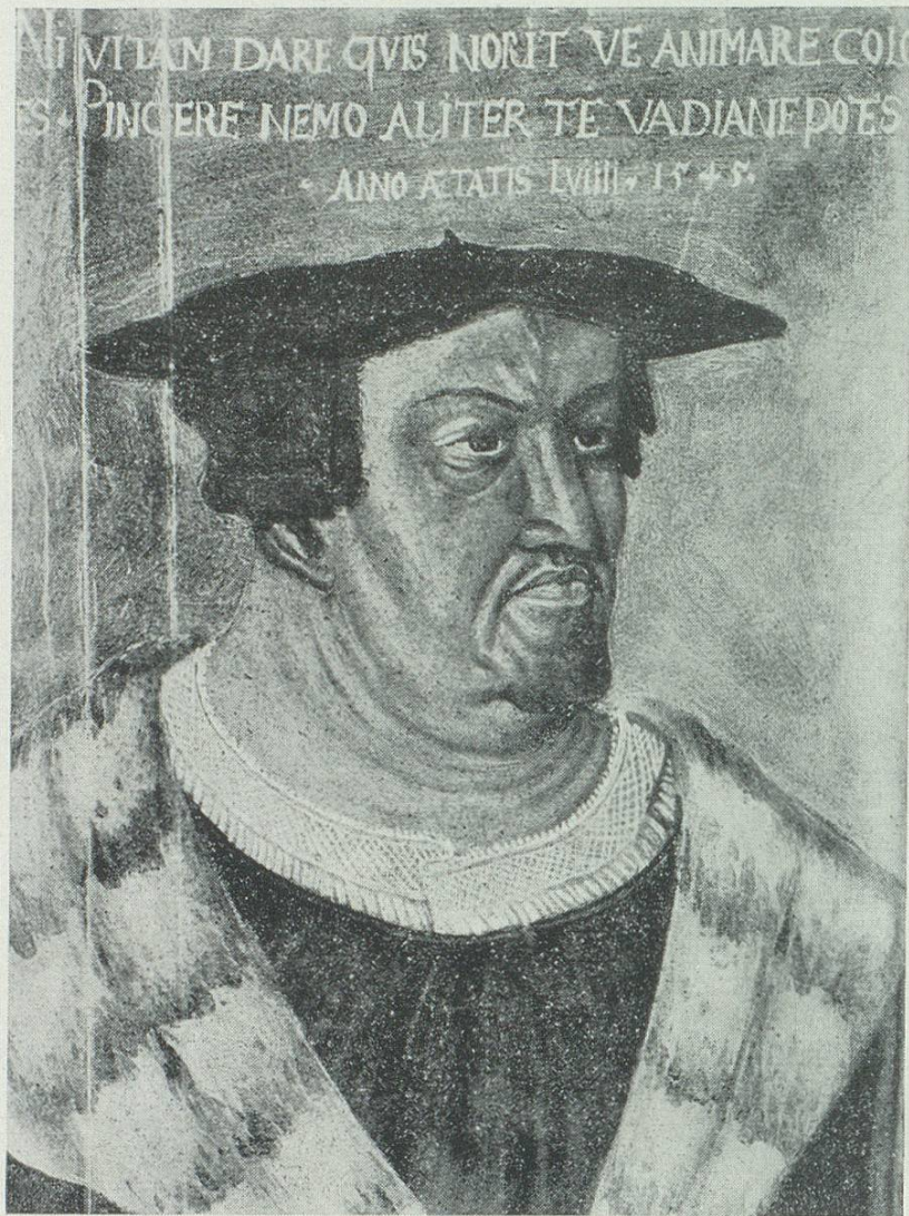
Joachim von Watt (Vadianus) 1484–1551 Ölbild von 1545 in Handschrift 43 der Vadiana «Große Chronik der Äbte».