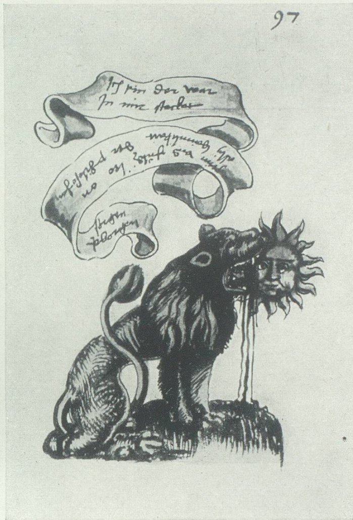
«Löwe, die Sonne verschlingend» Chemische Bedeutung: Sonne = Gold; grüner Löwe = Quecksilber In Handschrift 394a der Vadiana, abgebildet in Ciba-Zeitschrift 5, 1938, S. 1969