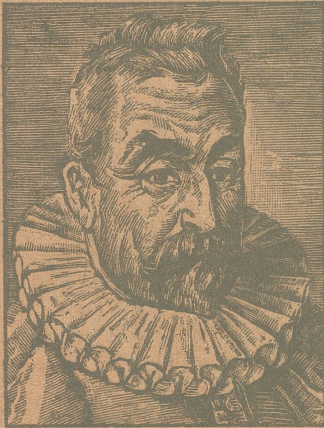
Jean Nicot bracht die Tabackspflanze nach Europa

Tabak, Tabak, Du edles Kraut! Der Mann sei lobenswert, Der dich gebaut! Der dich erbaut Und hat gepflanzt, Sei Lob und Ehr und Dank Sein Leben lang!