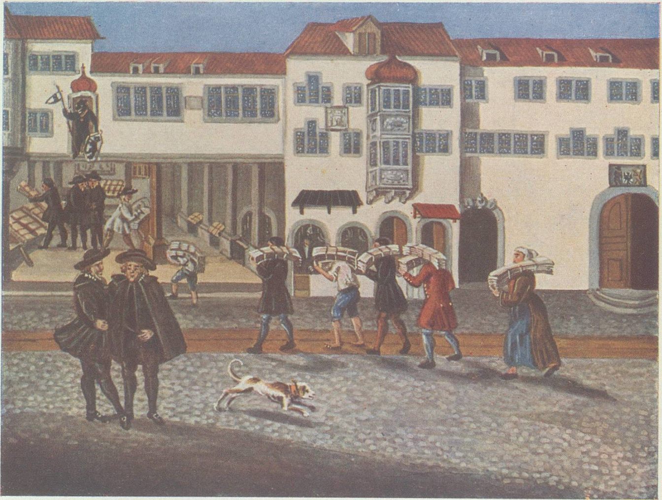
Leinwandverkauf im alten St.Gallen