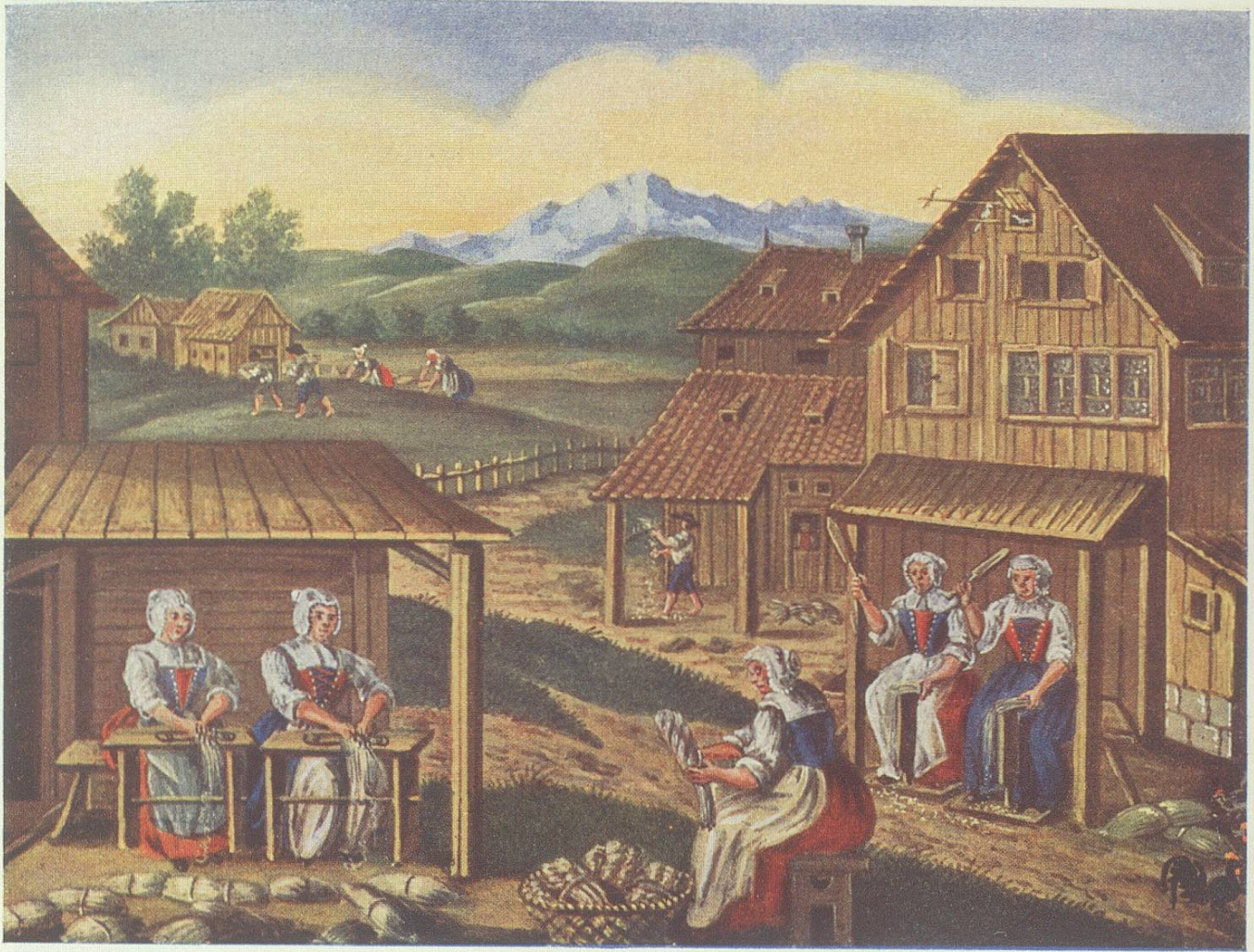
Flachsverarbeitung (Nach Aquarell von D. W. Hartmann)