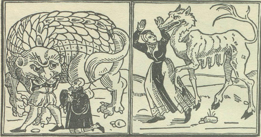
Aus der Sammlung Wickiana um 1520

«Ist irgend ein Mann so ein gute Frowen, oder ein Weib so einen guten lieben Mann hat, so mögen sie dieselbigen vor disen zweyen grausamen Thieren wol verwarnen | damit man aber wisse wie sie genennet werden, das erste so die gute Mann frisset, heißet Bigozne, das andere so die gute Weiber frisset wird genant Ciscefasche.»