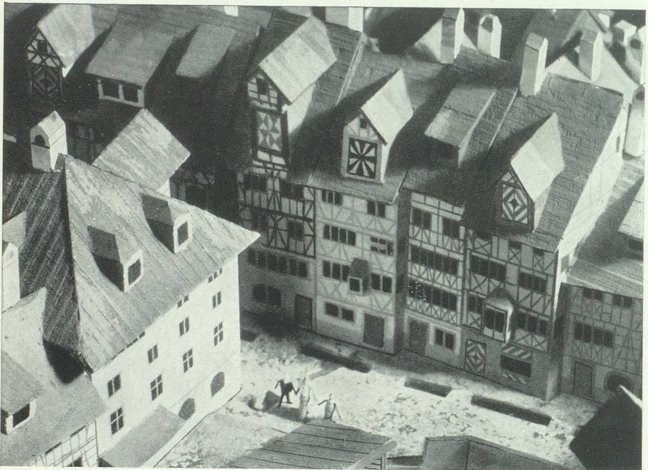
Ausschnitt: Einmündung der Neugasse in die Multergasse