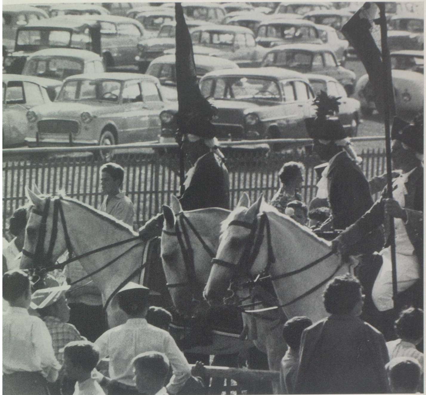
Pferd und Pferdekraft bewundern sich an den St.-Galler Pferdesporttagen