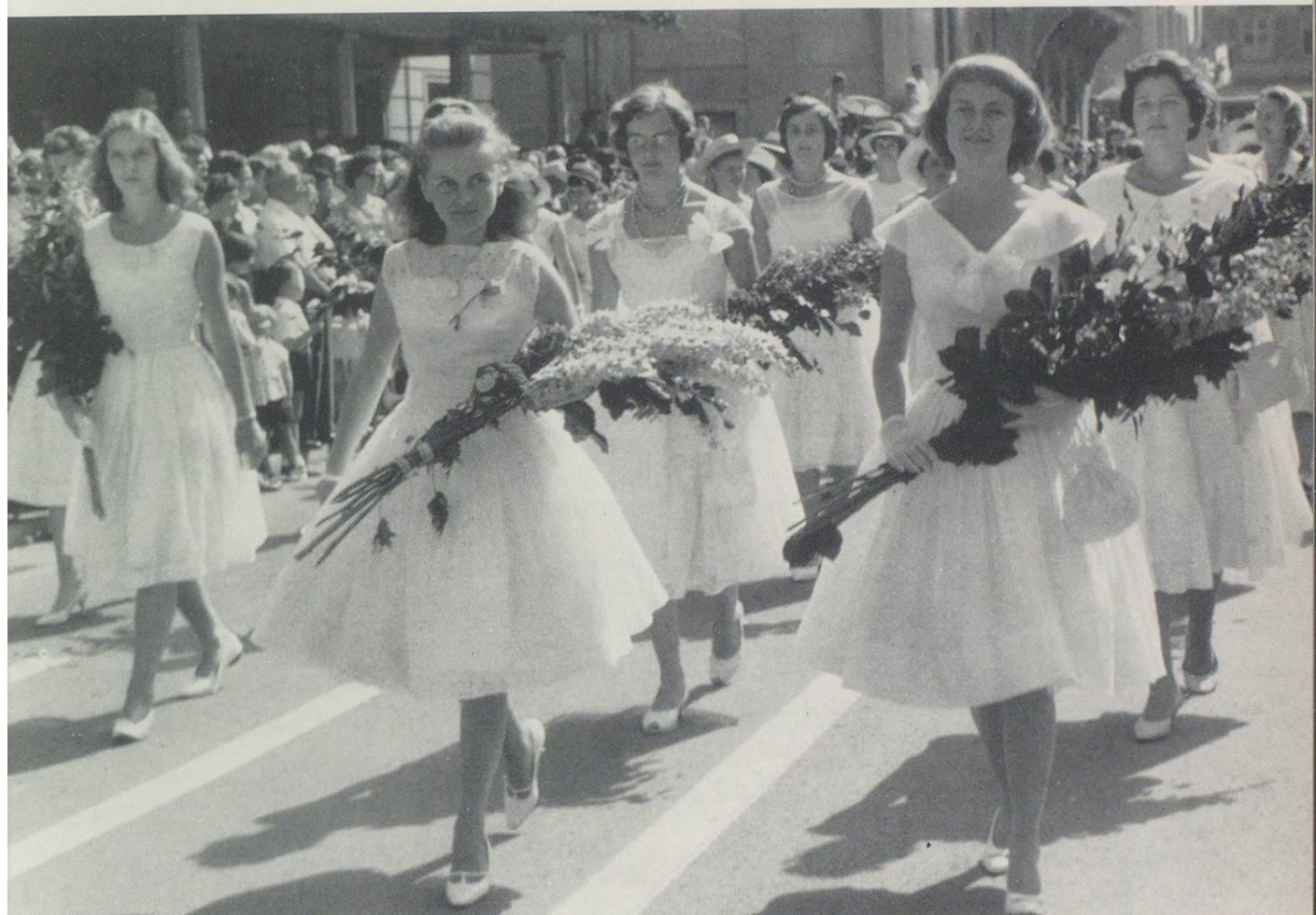
Blütenzauber im Glanze der St.-Galler Kinderfestsonne