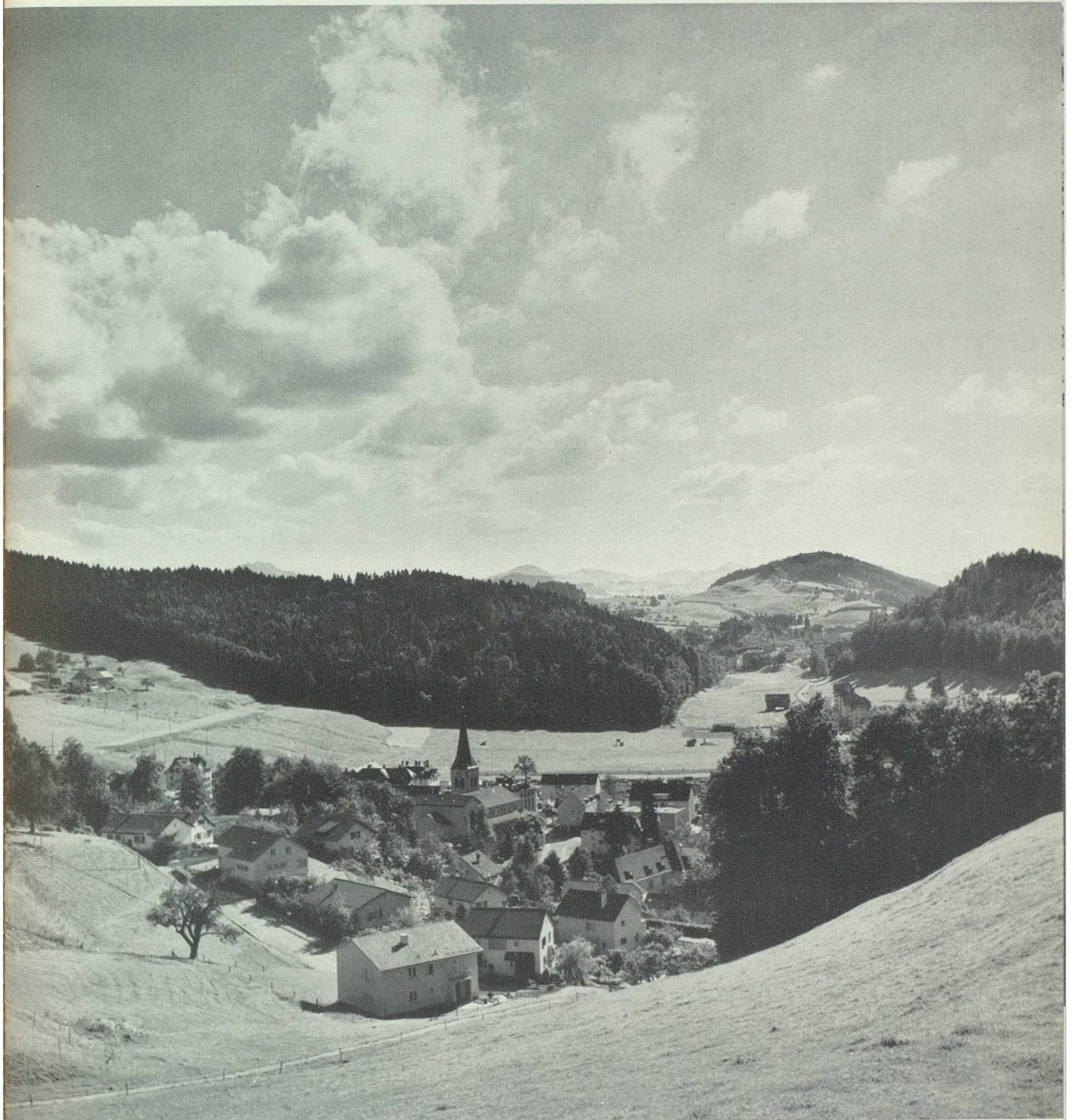
St. Georgen mit Tal der Demut