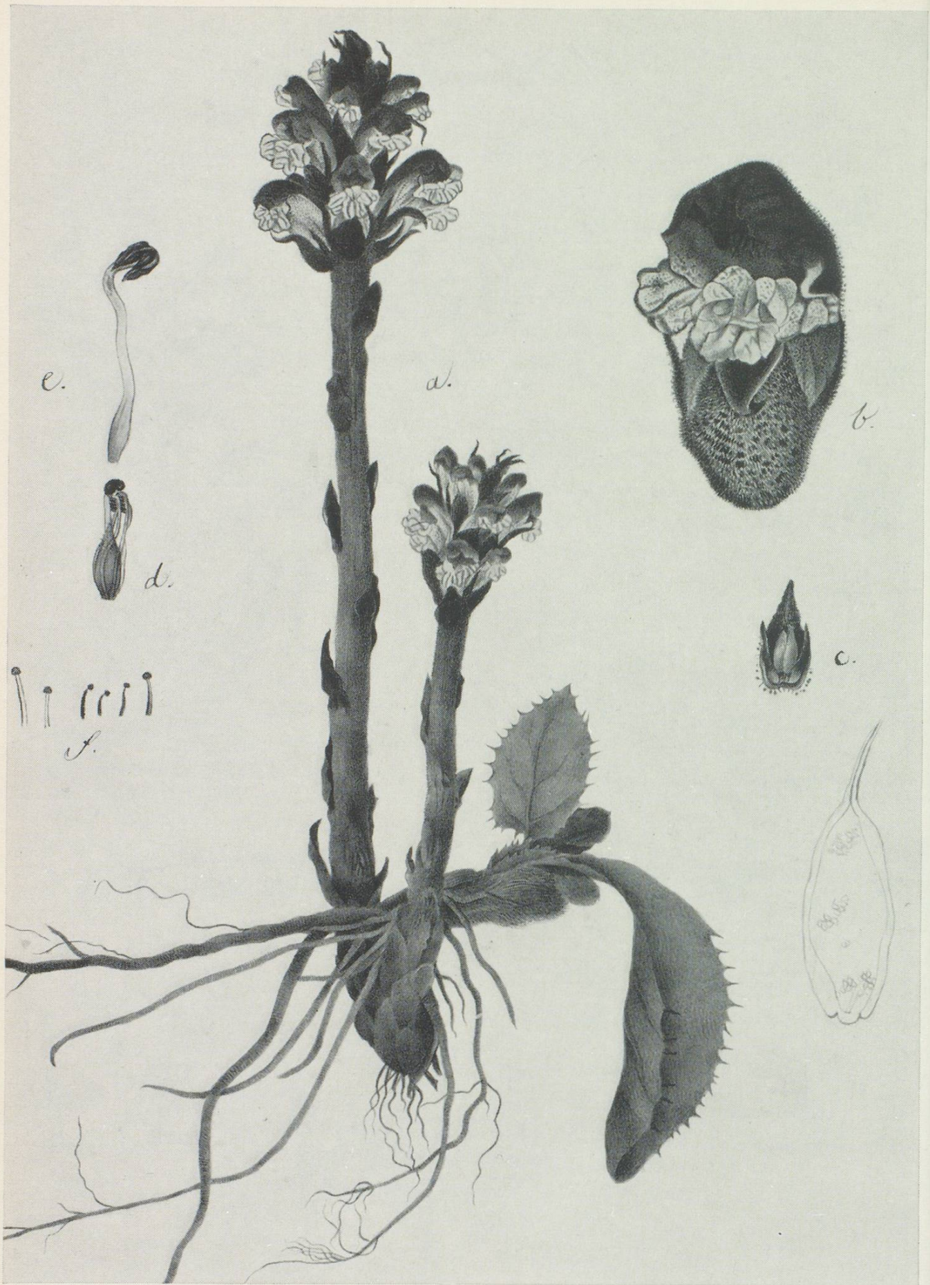
Sommerwurz ( Orobanchae scabiosae Koch), ein Schmarotzer, der ohne eigenes Blattgrün andern Pflanzen Säfte raubt, indem er ihre Wurzeln anzapft.