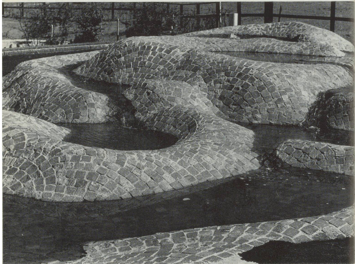
Die neue Schulanlage Steig in Wittenbach mit dem von Fredi Thalmann geschaffenen Spielbrunnen im Pausenhof.