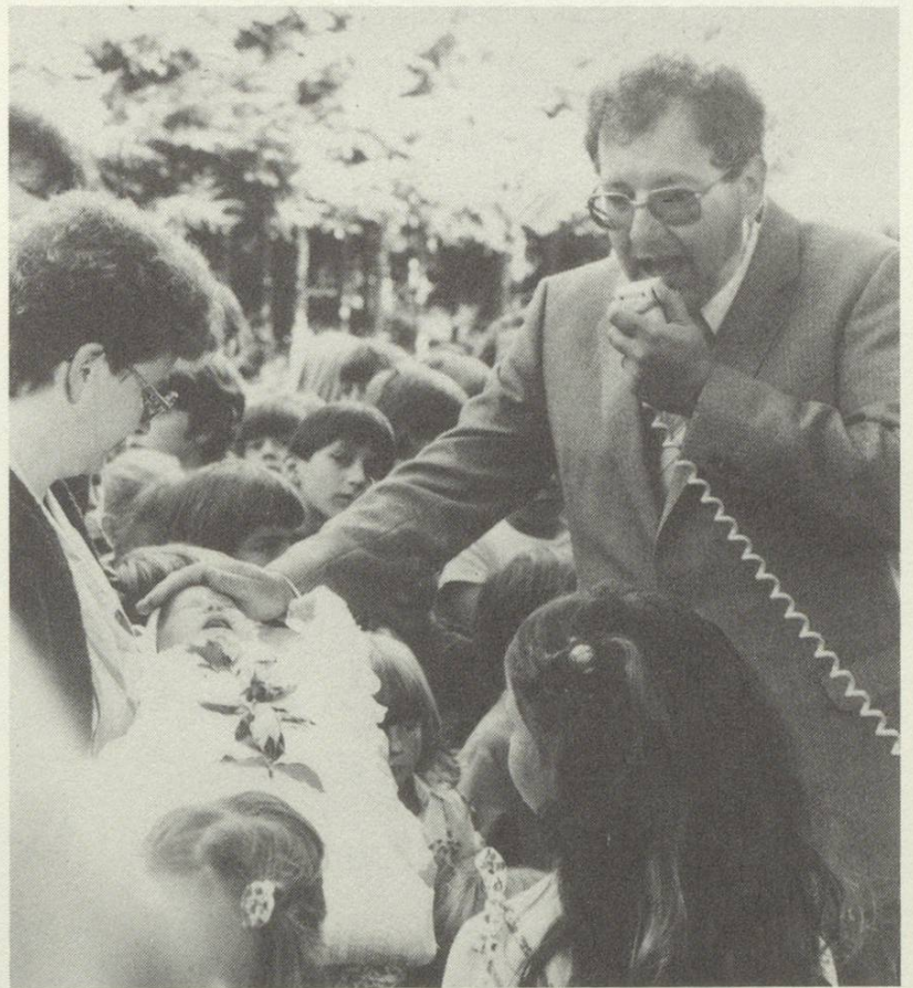
Taufe an einem Gottesdienst im Freien