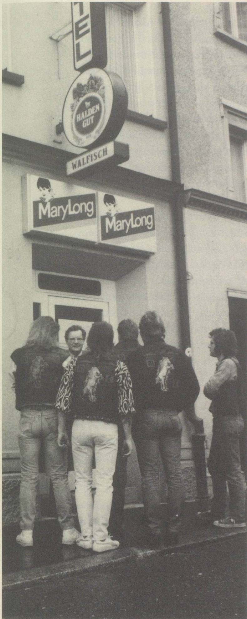
Die Unicorns kommen an den Stammtisch im «Walfisch»