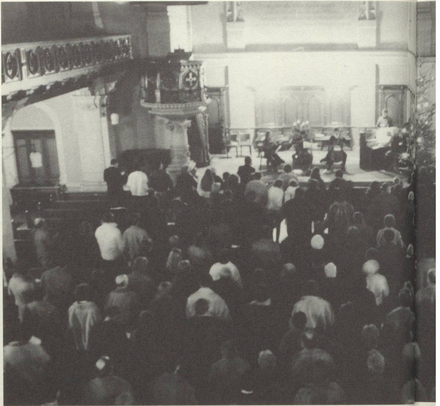
Linsebühlkirche, zur Weihnachtszeit

schen vorurteilslos zu begegnen», entkräftete er Bedenken weniger mutiger Zeitgenossen, die sich darüber wunderten, dass ihr Pfarrer auch ohne Bedenken die Motorradfans im Klublokal aufsuchte.