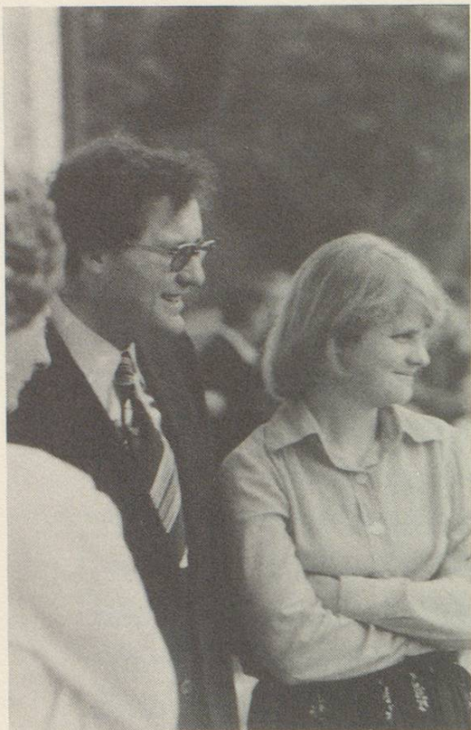
Mit Gattin Nelly