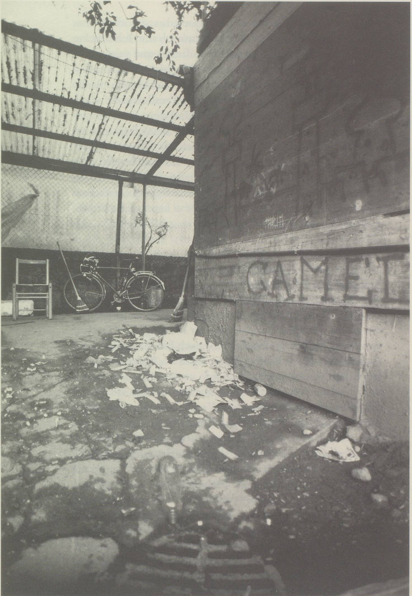
Keine ländliche Idylle, sondern Ausdruck eines zivilisatorischen Notstands von unüberbietbarer Hässlichkeit.