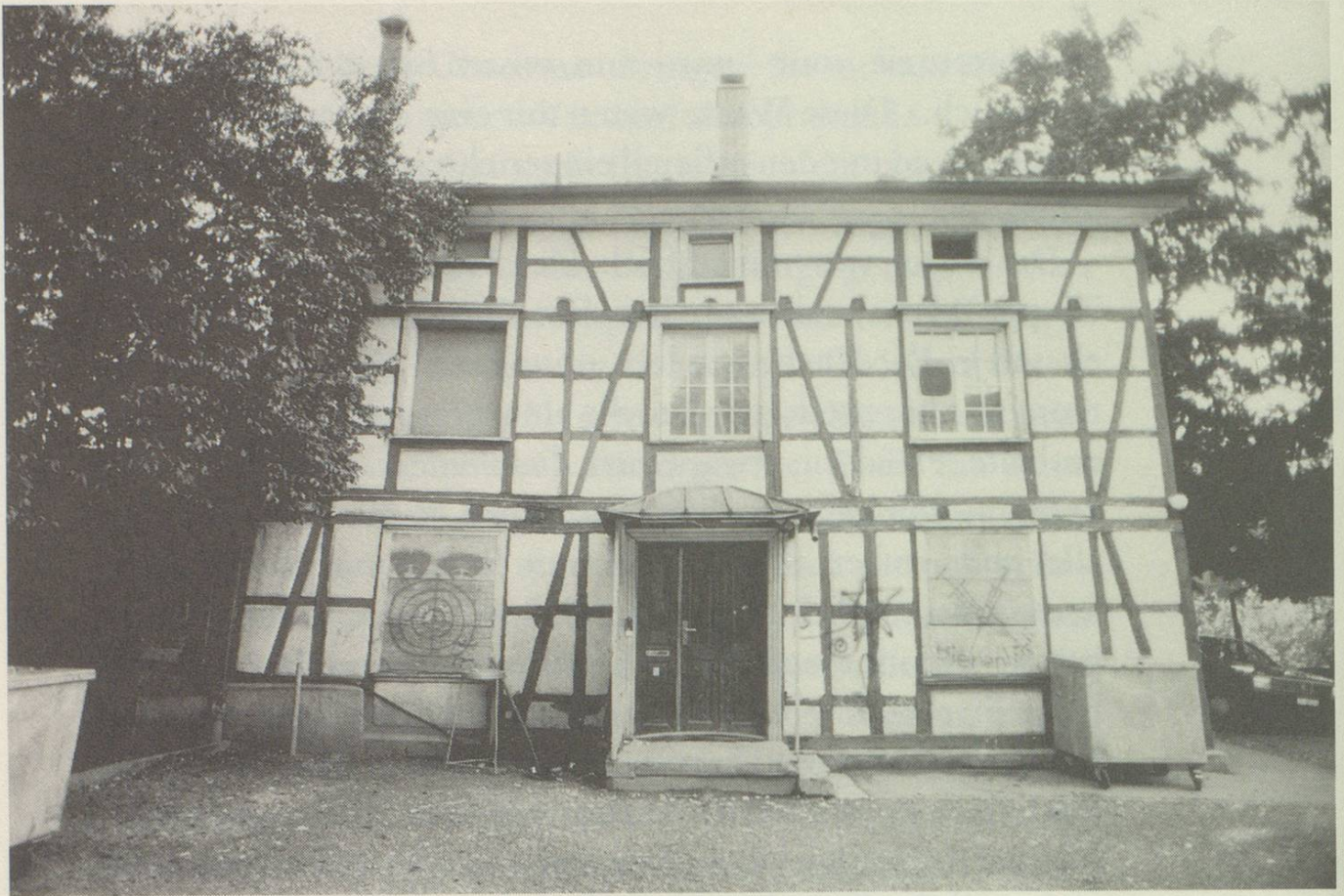
Das «Bienenhüsli» am Unteren Graben 55.