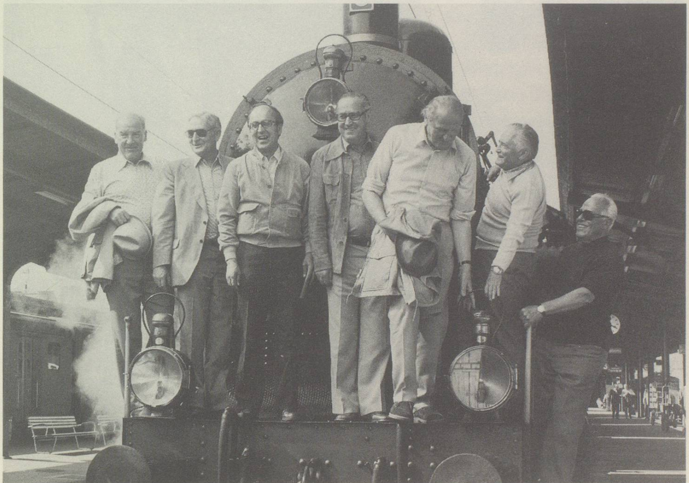
Bundsrats-Schulreise auf «Volldampf».