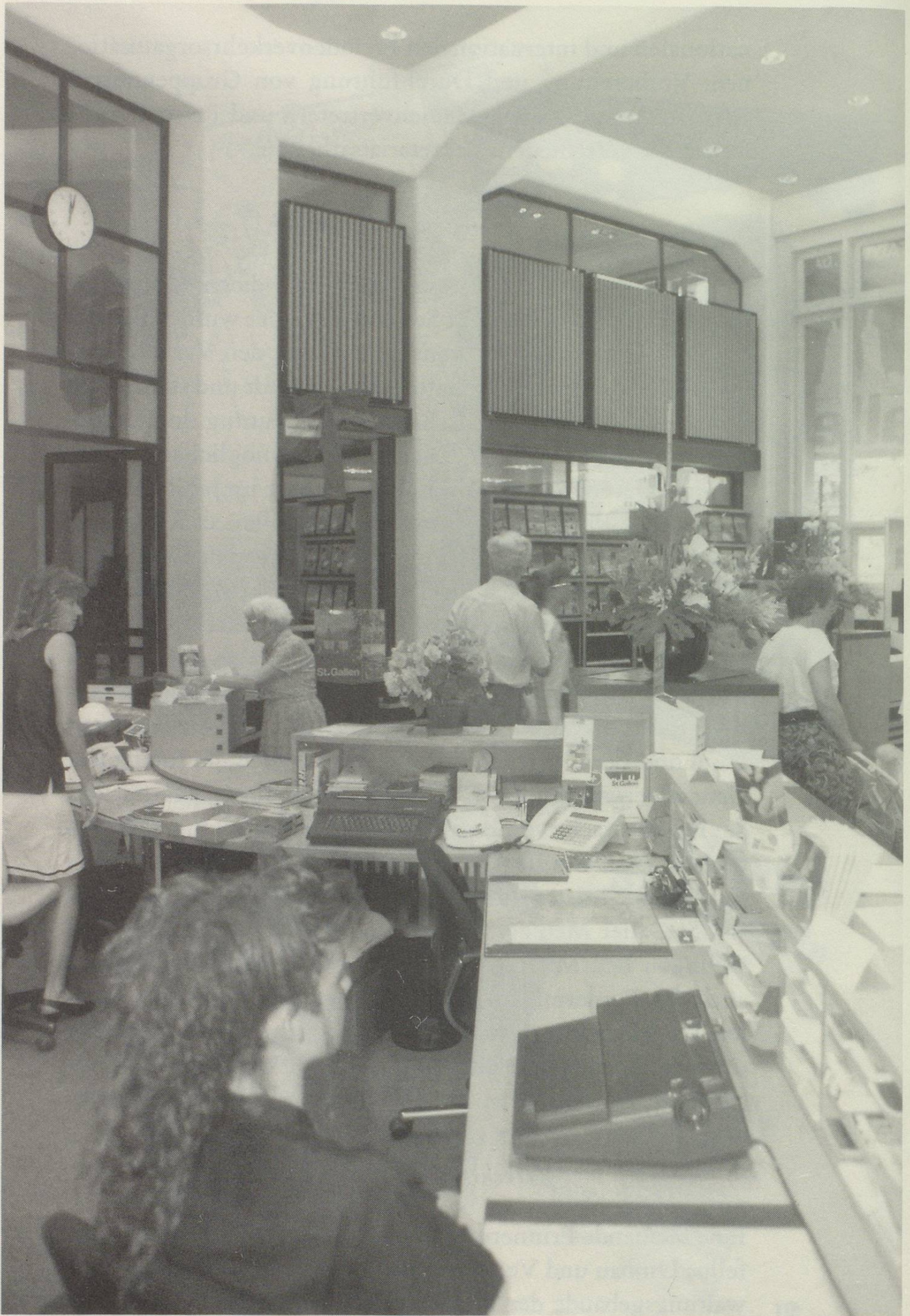
Das renovierte Verkehrsbüro mit dem neuen BT-Reisebüro.