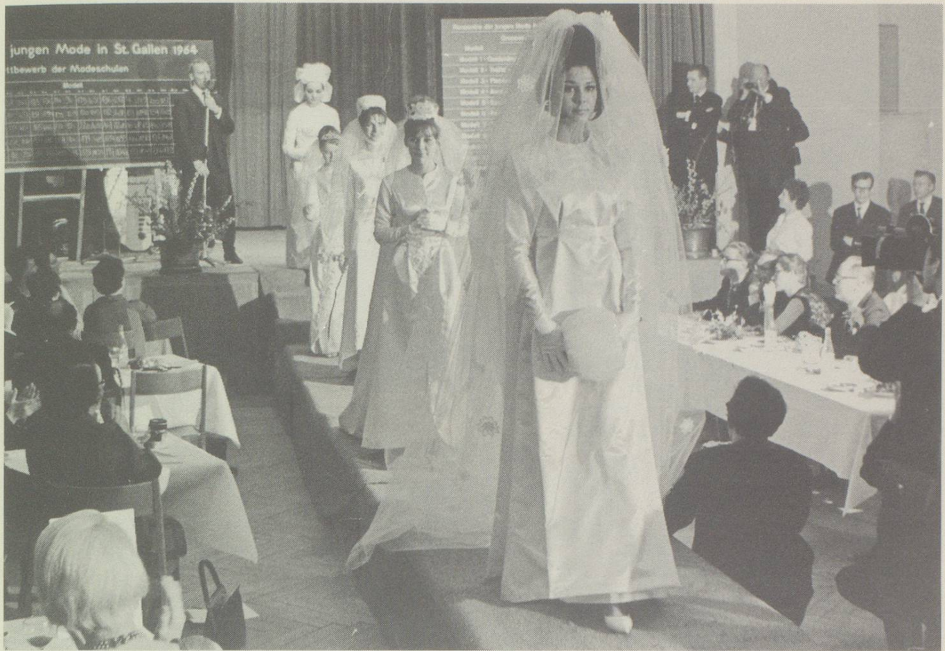
Eines der ersten St. Galler «Rencontre der Jungen Mode».