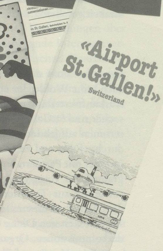
«Visitenkarten» aus der Werbeküche des Verkehrsbüros.