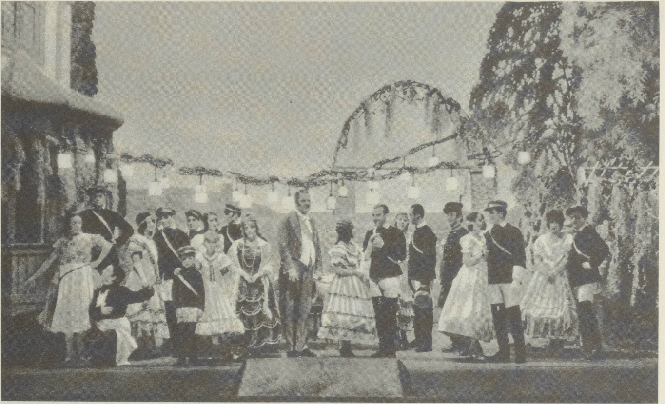
«Ich hab mein Herz in Heidelberg verloren» (aus der Zeitschrift «Schweizer Theater», Februar 1928)