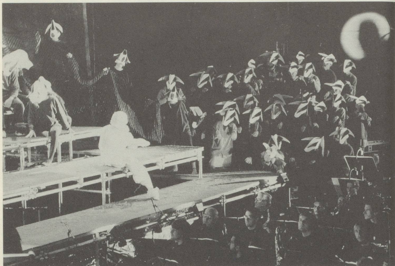
Open-Opera-Aufführung «Jeanne d'Arc au bûcher» in der Lok-Remise SBB St.Gallen 1992.