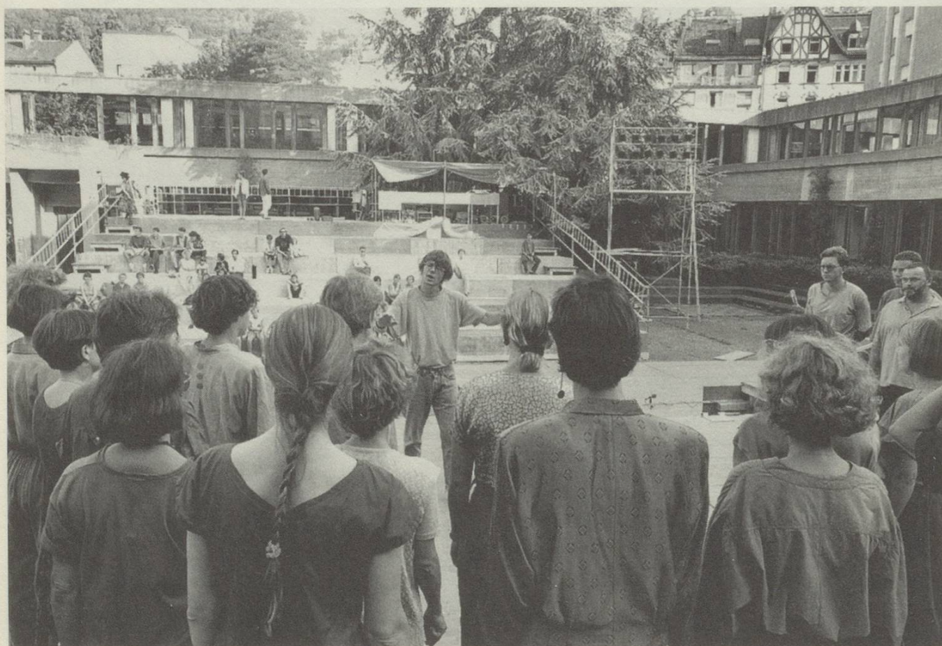
Proben zur Open-Opera-Aufführung «Titanic» im Innenhof der Kantonsschule St.Gallen 1991.