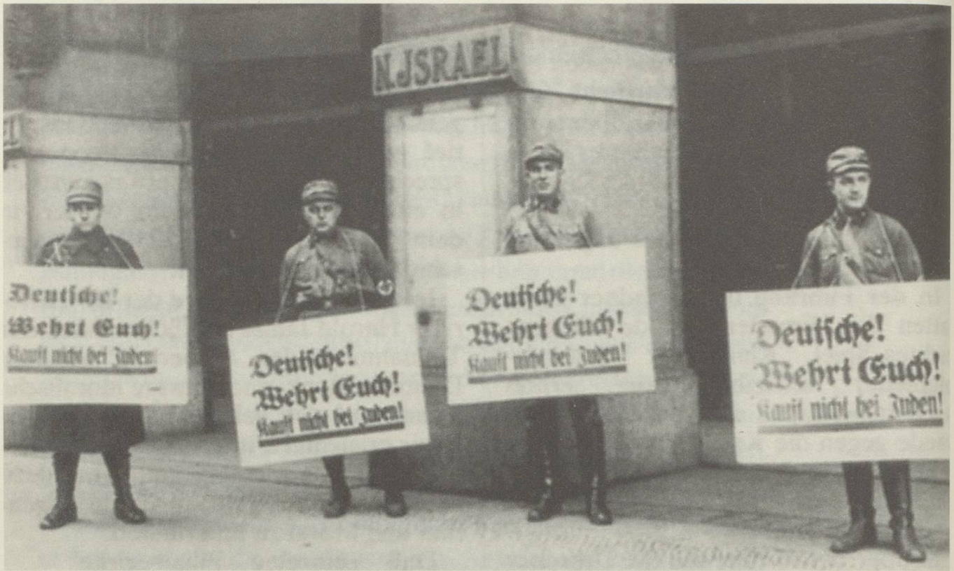
Erste Zeichen der Schrecken: Nazi-Boykott gegen jüdisches Warenhaus in Berlin 1933.