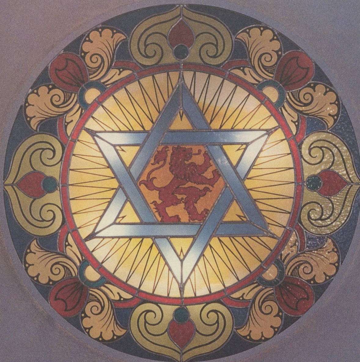
«Davidstern», Glasfenster der ehemaligen Synagoge an der Kapellenstrasse, St. Gallen.

«Bund junger Juden zur Abwehr des Antisemitismus» 1933