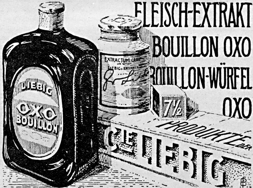
Bl. 620 g