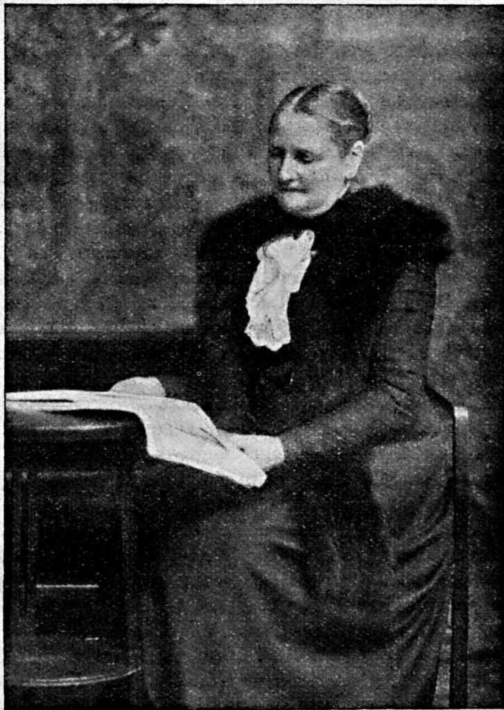
M me Chaponnière-Chaix in Genf Präsidentin des Internationalen Frauenbundes seit dem 15. September 1920

Nachdem der Jahresbericht genehmigt worden war, wickelten sich die folgenden statutarischen Geschäfte rasch ab: die von Fräulein Schindler , Biel, er-