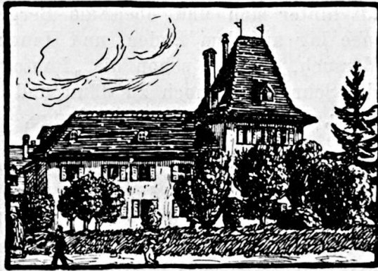
Gemeindehaus in Bümpliz-Bern

sorgt eine vom Zürcher Frauenverein für alkoholfreie Wirtschaften ausgebildete Betriebsleiterin mit tüchtigen Hilfskräften für das leibliche Wohl der Gäste. Wer sich in der getäferten Gaststube zur täglichen Mahlzeit einfindet, oder in einer Freistunde eine kleine Stärkung sucht, erfährt an sauber gedecktem Tische freundliche Aufnahme, wo ihm gegen bescheidenen Preis zuteil wird, was er begehrt. Auch jeder vorübergehende Gast, der auf einem Ausflug in der Gemeinde-stube Spiez kurze Rast hält, hat Gelegenheit, die Vorzüge von Küche und Keller zu erproben.