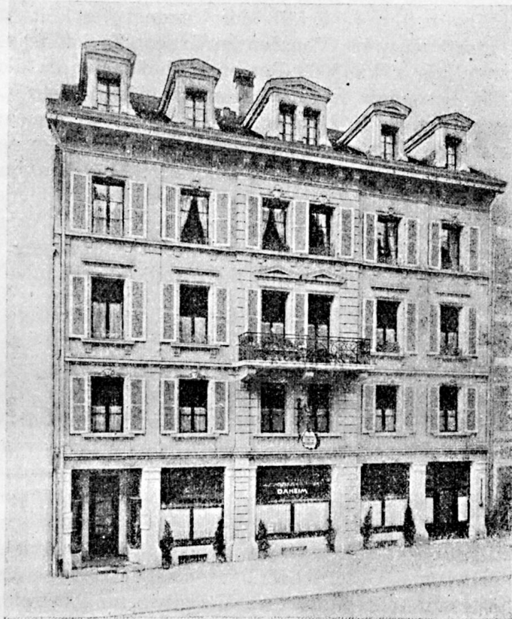
Vereins- und Gesellschaftshaus „Daheim“ Fassade Zeughausgasse

Aufzüge vermitteln den Speisenverkehr der einzelnen Stockwerke mit Küche und Konditorei, die grossen Ansprüchen zu genügen vermögen. Im zweiten Stockwerk reihen sich Sitzungs- und Kurszimmer aneinander an. Das Bureau der ständigen Sekretärin der Vereinigung weiblicher Geschäftsangestellter, und das anschliessende Bibliothekzimmer finden sich da. Das altdeutsche Lesezimmer des einstigen Daheim mit seinem Eichengetäfel und dem schönen Ofen blieb unverändert. Wie es im alten Frauenrestaurant war, so sind auch jetzt