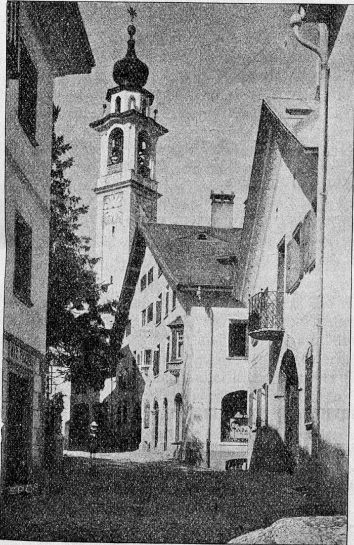
Dorfpartie von Samaden

Lundi 27 juin 1927: Ouverture des délibérations à 2 1 / 2 heures à la Salle communale