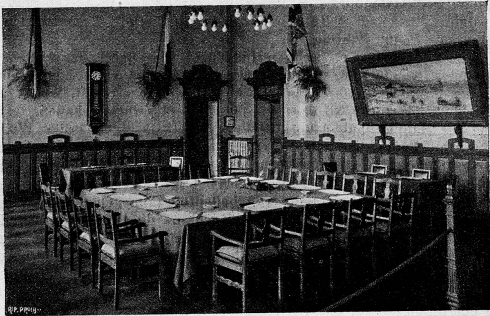
Friedenskonferenzsaal in Locarno

Es ist der 16. Oktober — Jahrestag der Unterzeichnung des internationalen Paktes, der den Namen Locarno über den ganzen Erdball trug und ihn zu einem eigentlichen Friedensbegriff gestempelt hat. Kein Tag, an dem nicht in der Weltpresse der Geist von Locarno zitiert wird, an dem nicht der Ruf nach einem zweiten, nach einem « Locarno des Ostens » erschallte! Im mildesten Gefilde der neutralen Schweiz, wo Fächerpalmen im Freien haushoch