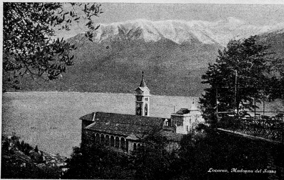
Madonna del Sasso

schon von weitem das Ziel. — Es war ein glücklicher Beschluss der Tessiner Behörden, den Konferenzsaal unbenutzt, ganz so zu belassen, wie er sich am 16. Oktober 1925 zeigte. — Seither ist er zur Wallfahrtsstätte für Tausende aus allen Ländern der Welt geworden. Voll Spannung, mit innerer Bewegung betritt man den geweihten Raum. Schweizerischen Besuchern mag es Befriedigung gewähren, dass man ihn für die internationale Zusammenkunft in schlichter heimischer Eigenart belies, ohne Zugeständnisse an fremden Prunk. Die Gäste aus den Weltstädten Paris, London, Berlin, Rom, Brüssel mögen sich über solch ungewohnte Einfachheit verwundert haben. Welch ein Gegensatz zu der fürstlichen Ausstattung des Friedenspalastes im Haag, den einstige