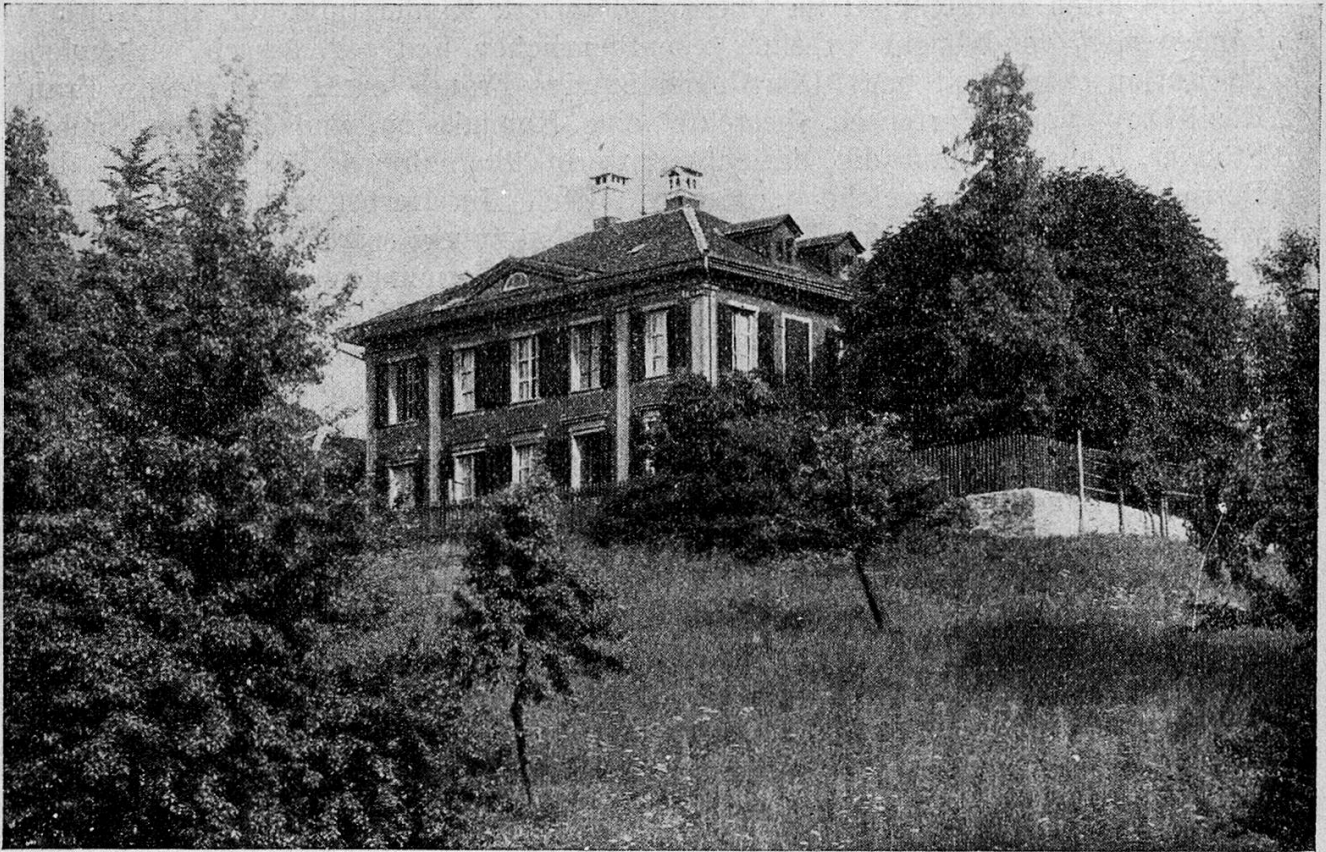
Das Kinderheim „Hubelmatt“ ob der Allmend in Luzern

Wir unterscheiden in erster Linie zweierlei Fälle: 1. Solche, die wir von den Behörden übernehmen, und 2. solche, bei denen die Eltern oder andere Personen genötigt sind, die Kinder vorübergehend unterzubringen. Die uns von der Vormundschaft zugewiesenen Pfleglinge sind zu einem ansehnlichen Teil