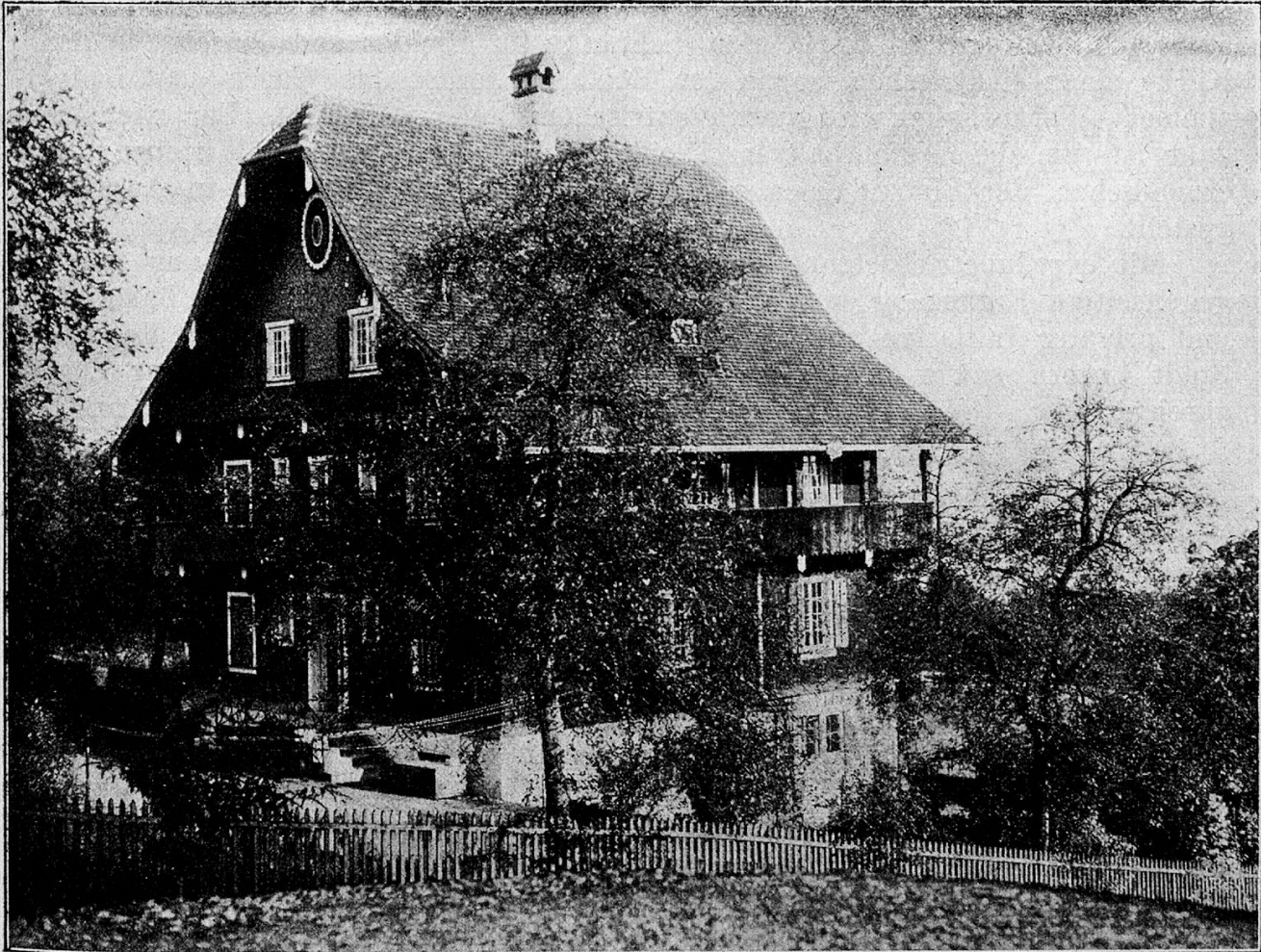
Das Frauenheim „Weidli“ in Meggen

Nach vorgängigen Unterhandlungen mit den Organen der Behörde stellte uns der tit. Stadtrat in entgegenkommender Weise und in Würdigung unserer bisherigen Leistungen und des guten gegenseitigen Einverständnisses die ausserordentlich günstig gelegene und geräumige Liegenschaft Hubelmatt ob der