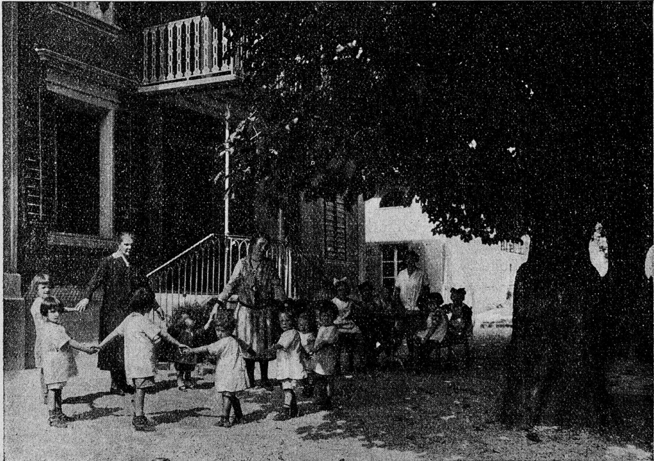
Spielplatz des Kinderheims „Hubelmatt in Luzern

Ein Teil der oft in alte und zerrissene Lumpen eingehüllten bedauernswerten Geschöpfe strotzt in vielen Fällen von Schmutz und Ungeziefer. Nach der