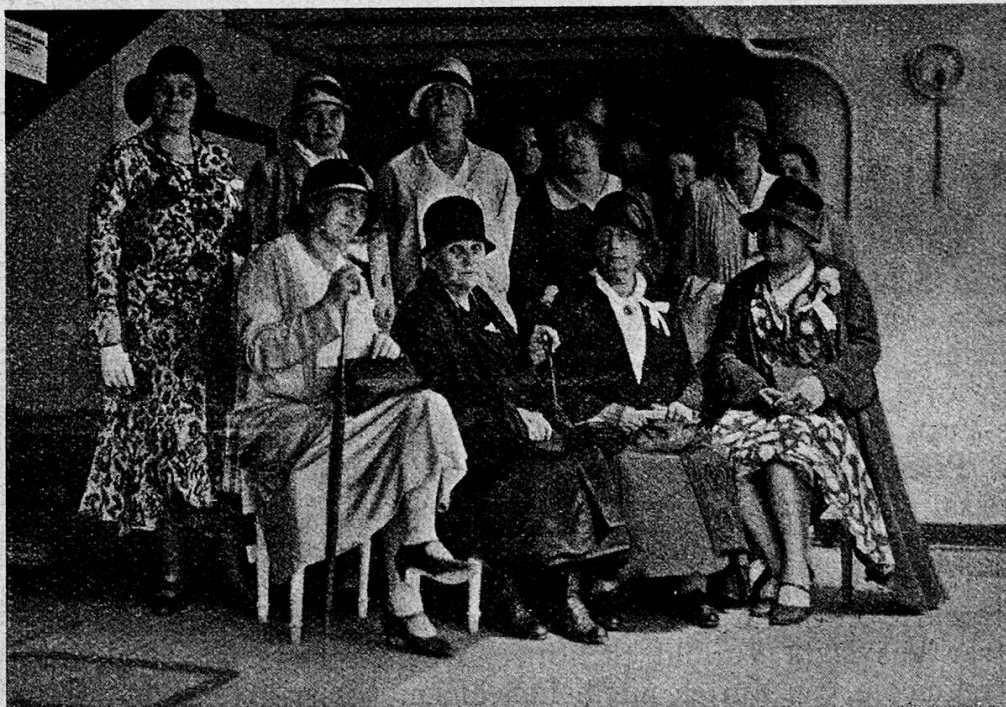
Mitglieder des Zentralvorstandes