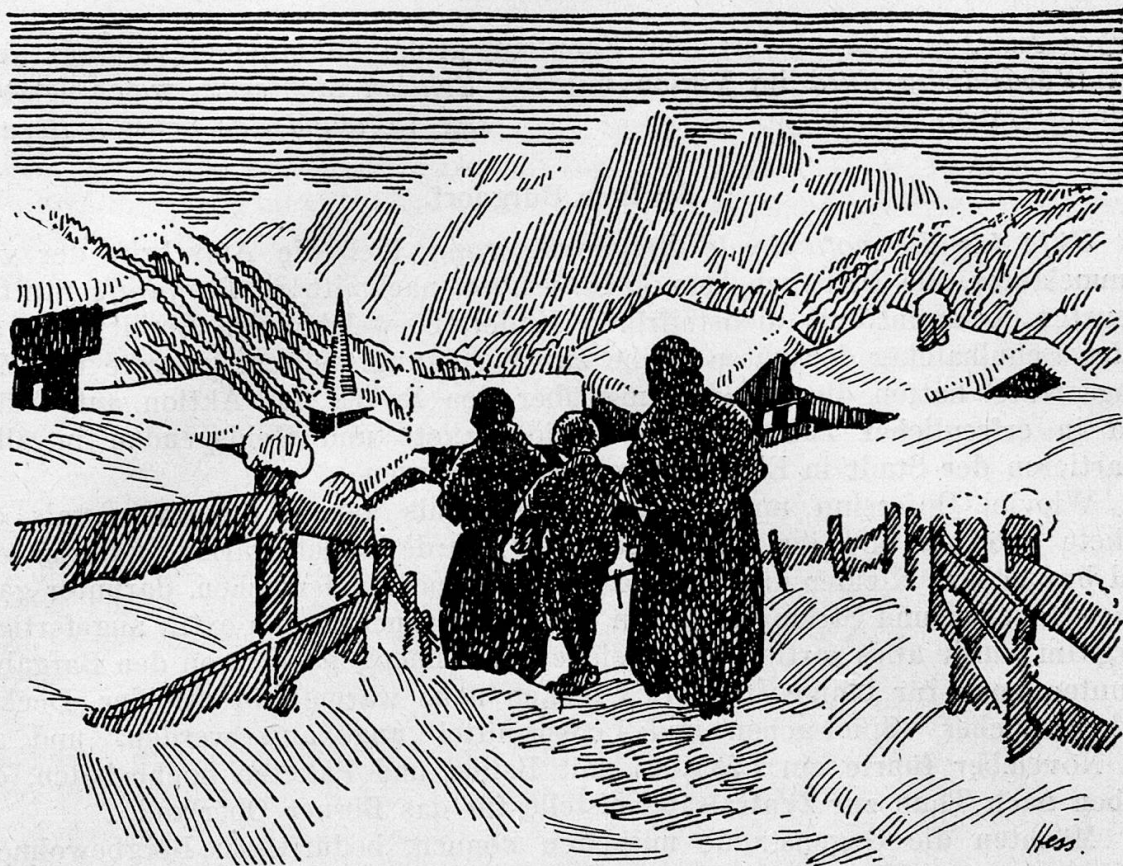
Weihnachtsabend in den Bergen