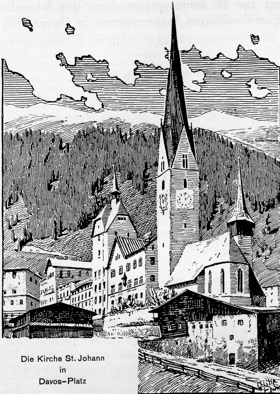
Die Kirche St. Johann in Davos-Platz

Seit 455 Jahren hat der 70 Meter hohe Kirchturm von St. Johann mit seinem schlanken Helm Wind und Wetter getrotzt. Die vielen Generationen, die seit seinem Bau im Jahr 1481 im hochgelegenen Bergtal lebten, blickten auf zu seiner leuchtenden Spitze und vernahmen den Klang der Glocken, der weithin vernehmbar ist.