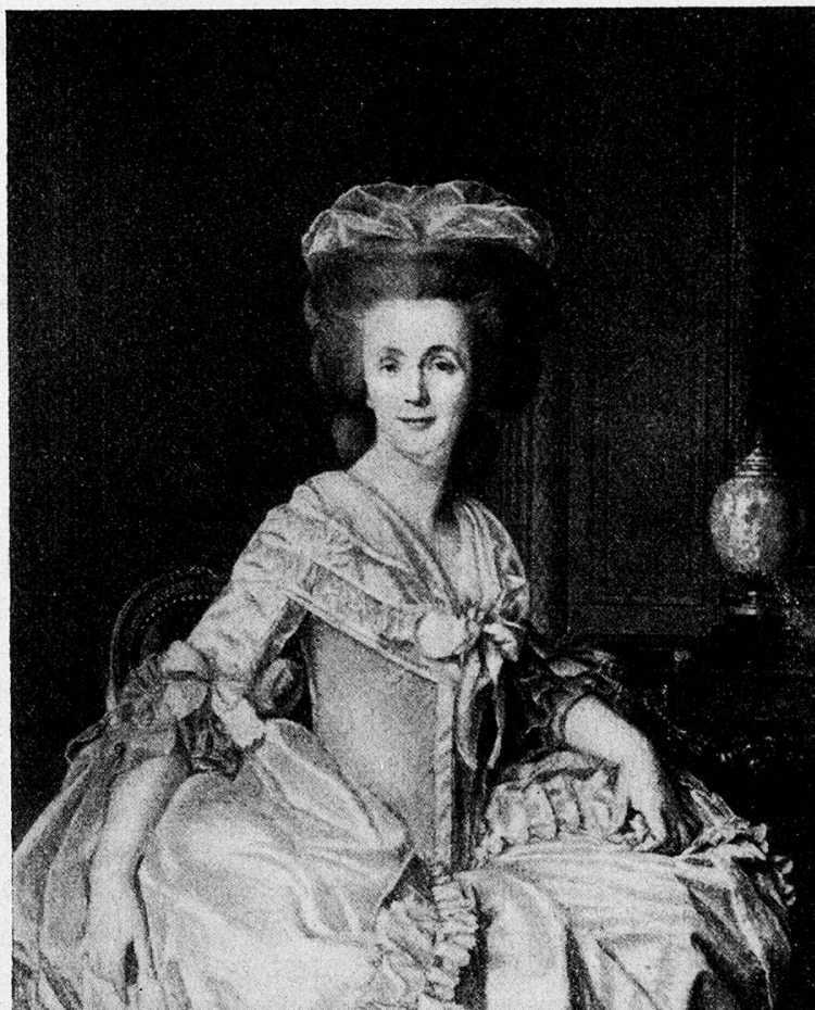
Madame Necker-Curchod 1737—1794

digster Weise der Historischen Gruppe der Saffa 1928 geliehen, und durften wir es im Kunstmuseum Bern ausstellen, wo es größte Bewunderung fand.