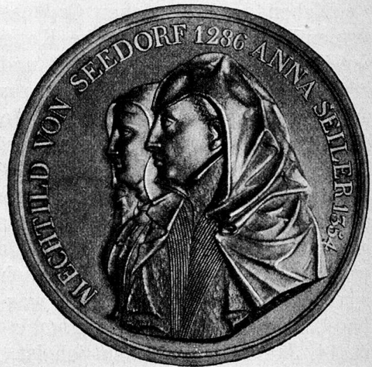
Medaille auf Anna Seiler und Mechtild von Seedorf die Stifterinnen des Inselspitals, 1286 und 1354