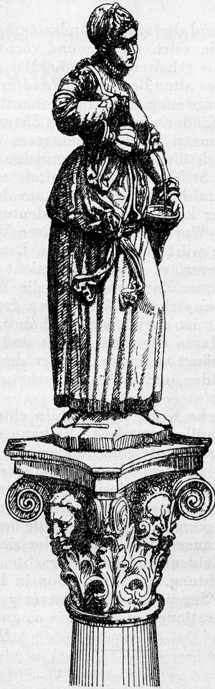
Anna Seiler Gründerin des Inselspitals in Bern

mete. « Der stolze Bau des Staates ist Manneswerk. Aber man soll bei solcher Feier nicht immer nur von den Männern, man soll auch von den Frauen sprechen, von den treuen Gefährtinnen, die an dem Hause mitbauten und es erfüllten mit heimatlicher Wärme. Man soll an die Mütter denken, die der Väter Ruhm bezahlten mit Entsagung, Herzeleid und bitterer Not, an die vielen, die Leid und Jammer hatten, an die Frauen, die nach Justingers Bericht am Vorabend der Laupenschlacht „wachten und uf dem kilchhof und in der kilchen weineten und got siner genaden baten“. Welch schwere Last lag in all den Kriegsjahren auf den schwachen Schultern eines Weibes! Wir neigen uns vor dem schlichten Heldentum so mancher braven Frau, die das Steuer eines vaterlosen Haushaltes in willige