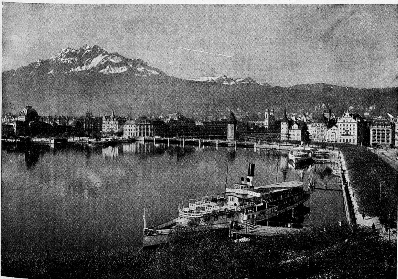
Luzern mit Pilatus*

des Schweizer. gemeinnützigen Frauenvereins am 22. Juni 1944 in Luzern