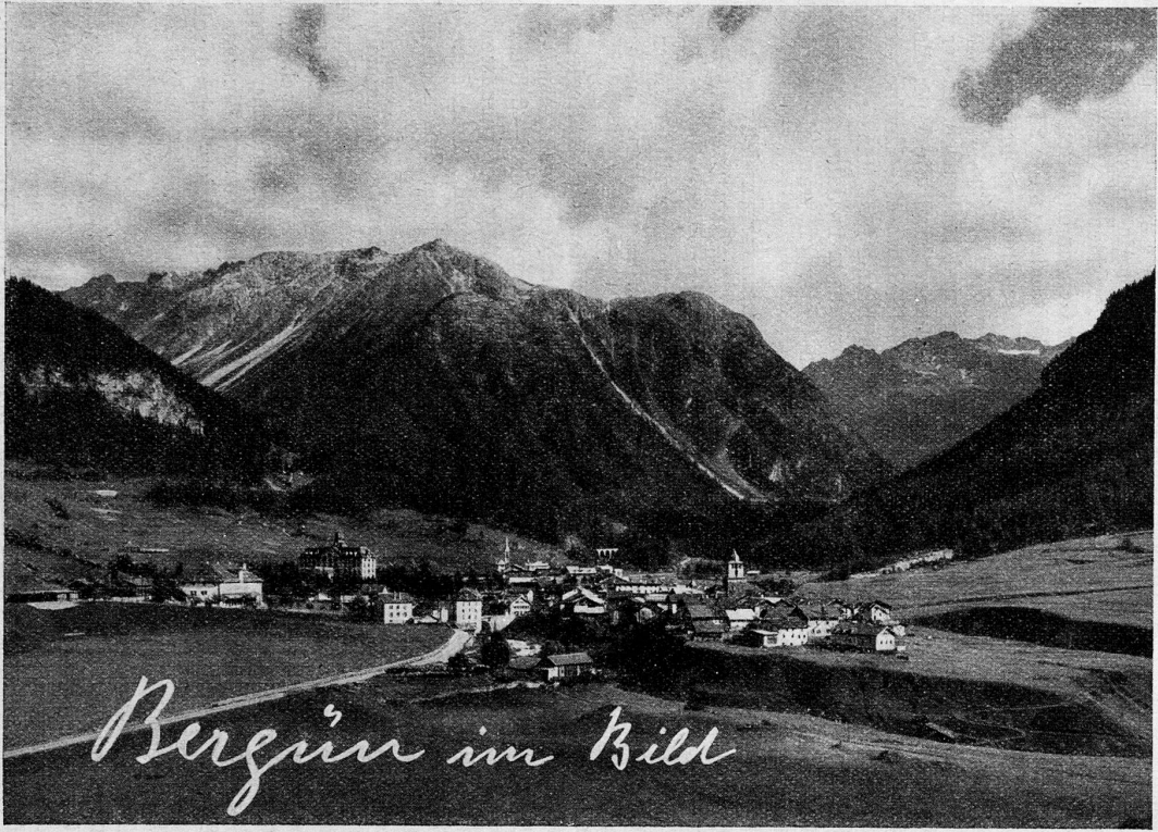
Bergün im rätischen Hochgebirge

Das Bild zeigt die Landschaft des Rätischen Hochgebirges in der Gemeinde Bergün. Die Aufnahme ist ein Werk des Fotografen [Name] und ist urheberrechtlich geschützt. Alle Rechte vorbehalten.