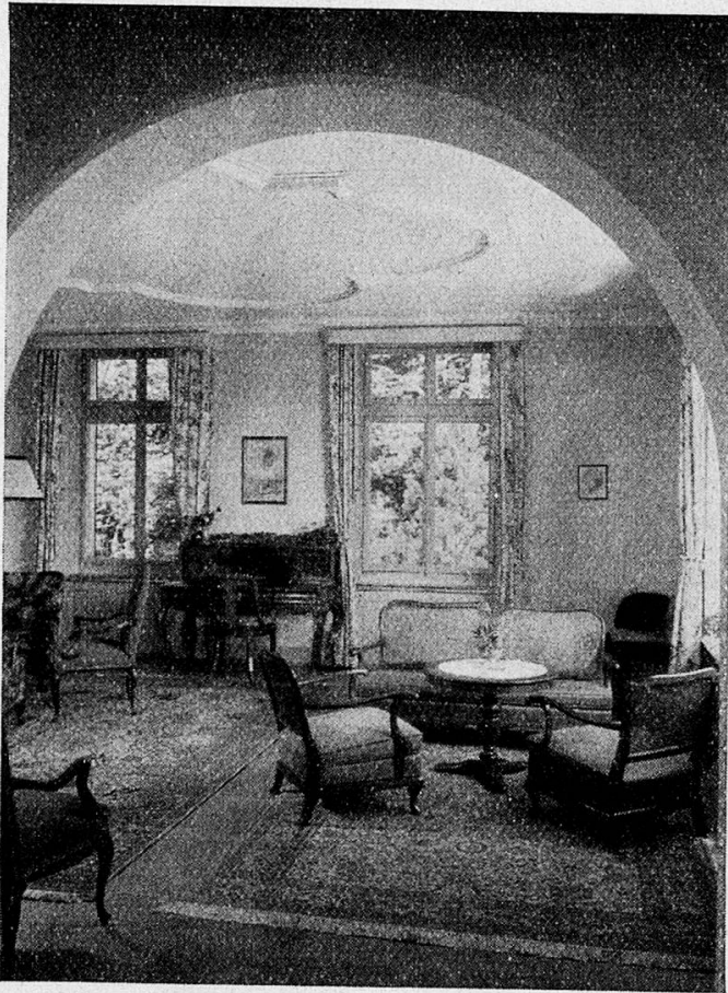
Kurhaus Zürichberg Wohnzimmer der Gäste

Im Anfang standen 55 Sitzplätze zur Verfügung, heute sind es 3166 geworden. Waren es zuerst 100 Gäste im Tag, die sich vom Verein verpflegen ließen, so ist die Zahl im Jahr 1944 auf 14 350 gestiegen und wird auch jetzt von Monat zu Monat größer. In den 50 Jahren wurden mehr als 182 Millionen Personen bewirtet. Es ist selbstverständlich, daß der Zürcher Frauenverein ein gewichtiger Verbraucher von Landesprodukten geworden ist, benötigte er doch seit seinem Bestehen rund 44 Millionen Liter Milch, für 6 Millionen Franken Gemüse und für 4,6 Millionen Franken Obst. Er wurde auch der größte Förderer der alkoholfreien Obstverwertung und verhalf dem Süßmost im Lauf der Jahre zu seiner Popularität. In den letzten 25 Jahren konnten 1\frac{1}{4} Millionen Liter aus- geschenkt werden.