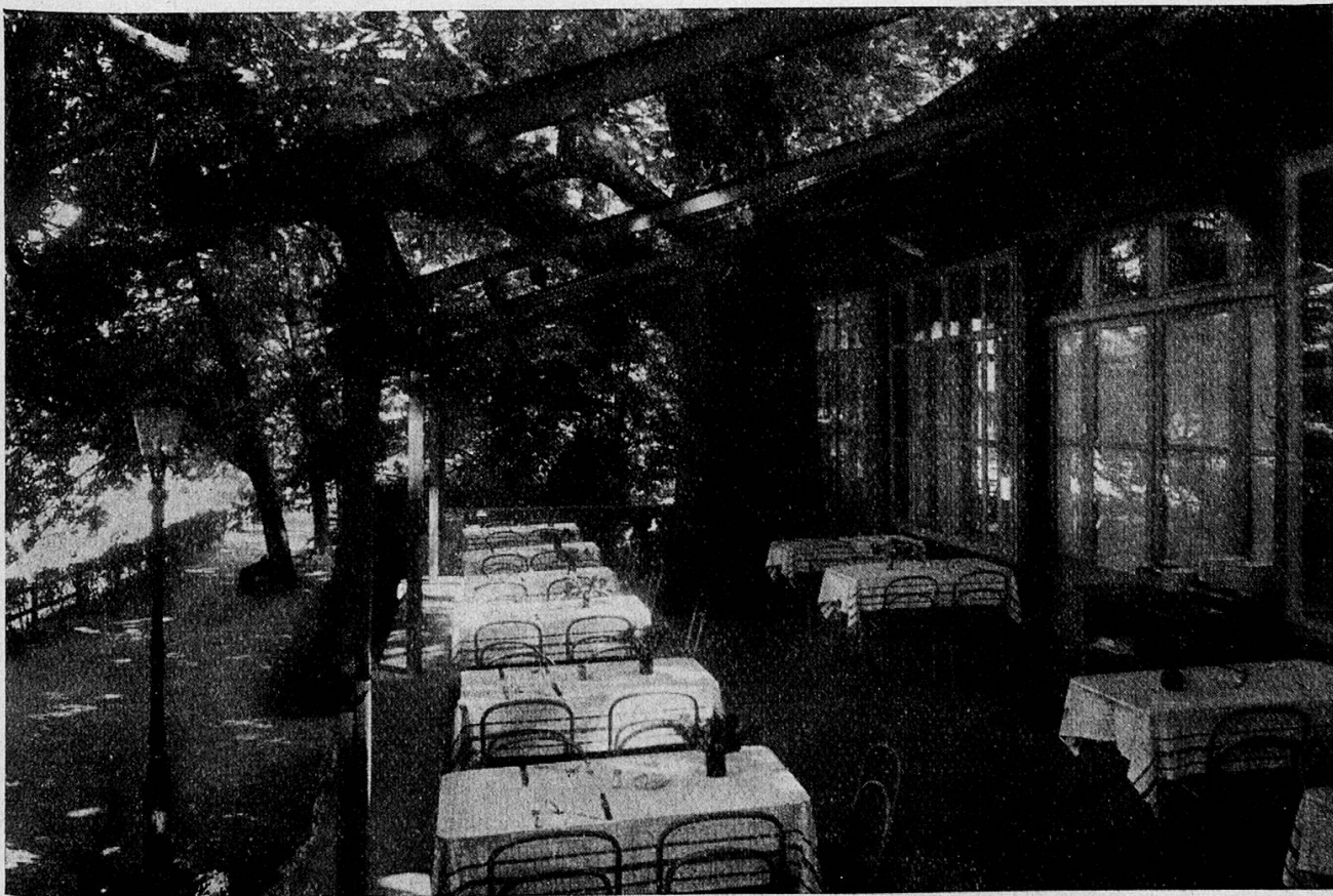
Restaurant Platzpromenade, Terrasse gegen die Sihl

Der « Zürcher Frauenverein für Mäßigkeit und Volkswohl » plante, alkoholfreie Gaststätten zu gründen und eröffnete im kleinen « Marthahof » an der Stadelhoferstraße am 17. Dezember 1894 eine Kaffeestube. Das Werk entfaltete sich rasch und bewies, wie groß das Bedürfnis für alkoholfreie Gaststätten war. 1898 konnte der erste Großbetrieb « Karl der Große » die Gäste willkommen heißen. 1901 dann konnte mit seiner prachtvollen Aussicht auf See und Alpen ein alkoholfreies Kurhaus und Ausflugsziel, der « Zürichberg », erbaut werden. Neue Häuser, vor allem auch in den Industriequartieren, öffneten sich den Gästen und halfen mit ihren billigen Preisen der werktätigen Bevölkerung zu gesunder und reichhaltiger Ernährung. Noch während diesem Kriege gelang es trotz vielfachen Schwierigkeiten, im Zentrum der Stadt das allen modernen Anforderungen entsprechende Stadthotel « Seidenhof » in Betrieb zu nehmen. Der « Zürcher Frauenverein für alkoholfreie Wirtschaften », wie er sich seit 1910 nennt, führt heute 15 Restaurants, 2 Kurhäuser und 1 Stadthotel; dazu wurde ihm die Leitung über 4 Buffets an Schulen in Zürich anvertraut.