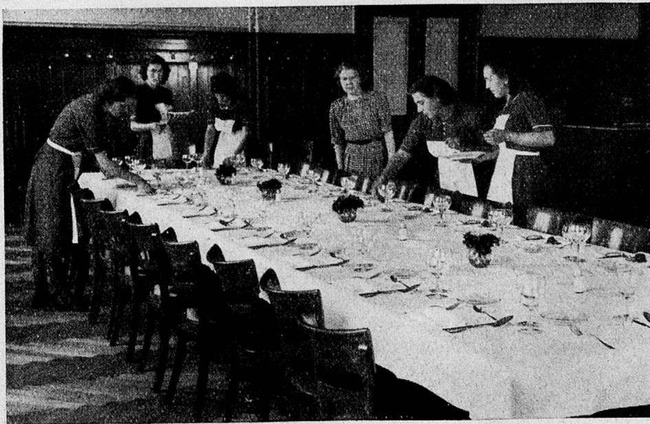
Ausbildung der Serviertöchter 1944

Nicht nur die eigentlichen Lehrtöchter, sondern auch die übrigen Angestellten werden von Zeit zu Zeit zu Fortbildungskursen zusammengerufen. In diesen wird ihnen sowohl die Möglichkeit zum beruflichen Vorwärtkommen als auch die Freude an der von ihnen verrichteten Arbeit geweckt. Außerberufliche Vorträge, Turnstunden, Flickkurse, Ausflüge und Feste helfen mit, die Angestellten zu sinnvoller Freizeitgestaltung zu erziehen.