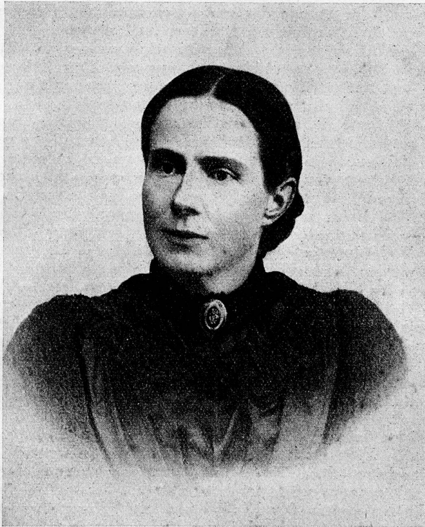
Frau Dr. Marie Heim-Vögtlin