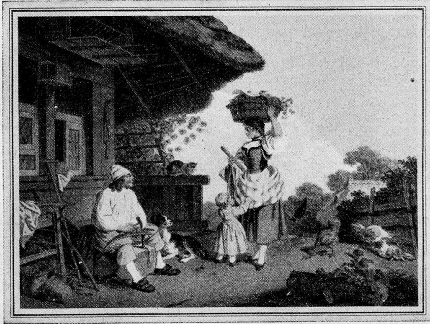
S. Freudenberger 1745—1801

Zugunsten der schulentlassenen Schweizer Jugend gelangt Pro Juventute an alle Jugendfreunde mit der Bitte, die feinen Marken und reizenden Karten zu erwerben.