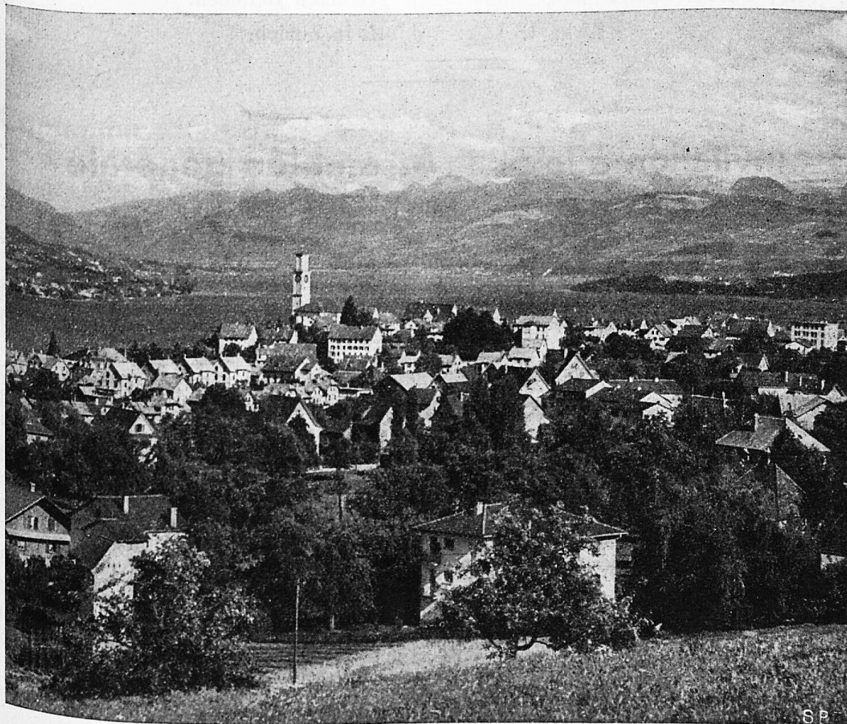
Thalwil am Zürichsee