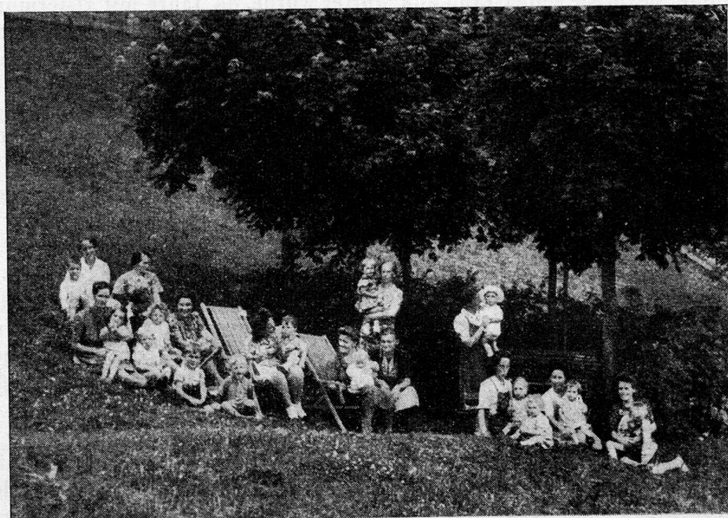
Mütter und Kinder im Freien

die « Sonnenhalde » vor gefährlichen Krankheiten oder Epidemien bewahrt. Die gute Witterung, das bekömmliche und reichliche Essen sowie ein guter Hausgeist haben zusammengewirkt, daß sich unsere Gäste fast ausnahmslos erfreulich gut erholten und schöne Erinnerungen mit nach Hause nehmen konnten.