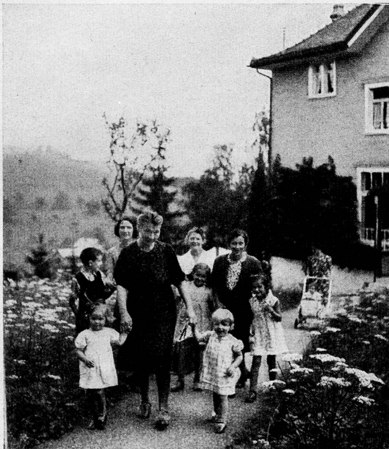
Auf dem Spaziergang

Haben nun Mütter- und Kinderhaus in den 15 Jahren ihrer Existenz die Erwartungen erfüllt, die man bei Eröffnung des Heims hegte? Um die Frage zu beantworten, ist es wohl am besten, die Statistik zu Hilfe zu ziehen; denn die Beliebtheit einer öffentlichen Institution kommt oft durch eine mehr oder weniger starke Inanspruchnahme von seiten des Publikums zum Ausdruck.