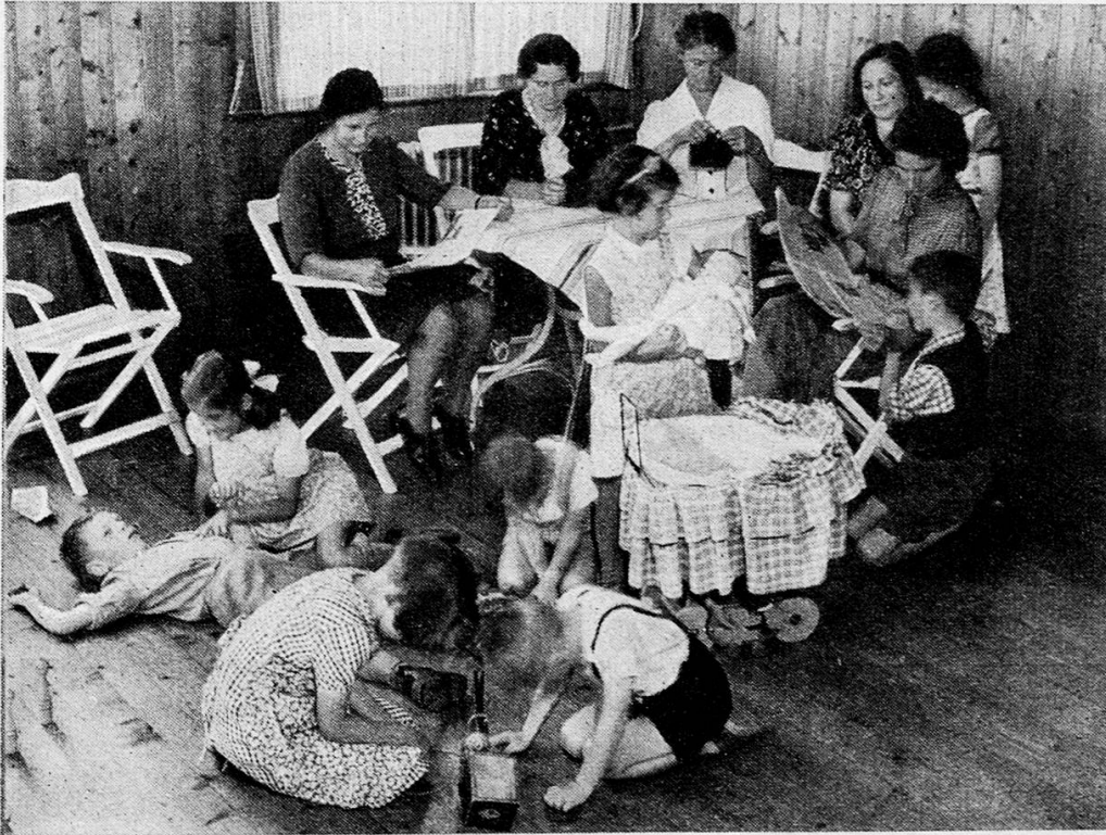
Spiel- und Arbeitszimmer

Da ist einmal auf die Lieblichkeit des Appenzellerländchens hinzuweisen, auf die klimatisch ausgezeichnete Lage mit der großen Sonnenscheindauer und