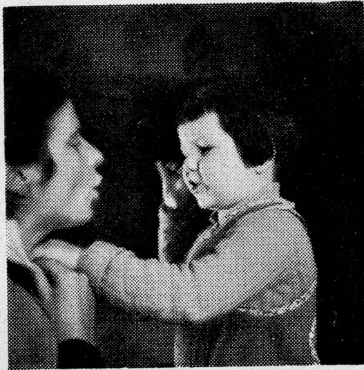
Taubstummes Kind bei Sprechübungen

Nobel-Preises, der schrieb: « Laßt uns unsere Fähigkeiten aufs äußerste entwickeln und in unserm Bereich eine höchste Zuständigkeit und Gewandtheit erringen », Dostojewskij , Notker der Stammler , Helen Keller , die taub und blind geborene Enkelin eines nach Amerika ausgewanderten Auslandschweizers, die durch ihre Ausbildung Akademikerin und Schriftstellerin wurde. Gekrönt wird die Reihe durch das Bild unseres Zeitgenossen Franklin D. Roosevelt .