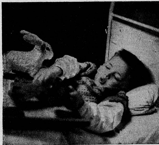
In der orthopädischen Klinik — nach der Operation

Geben wir ihr die Mittel, um helfen zu können.