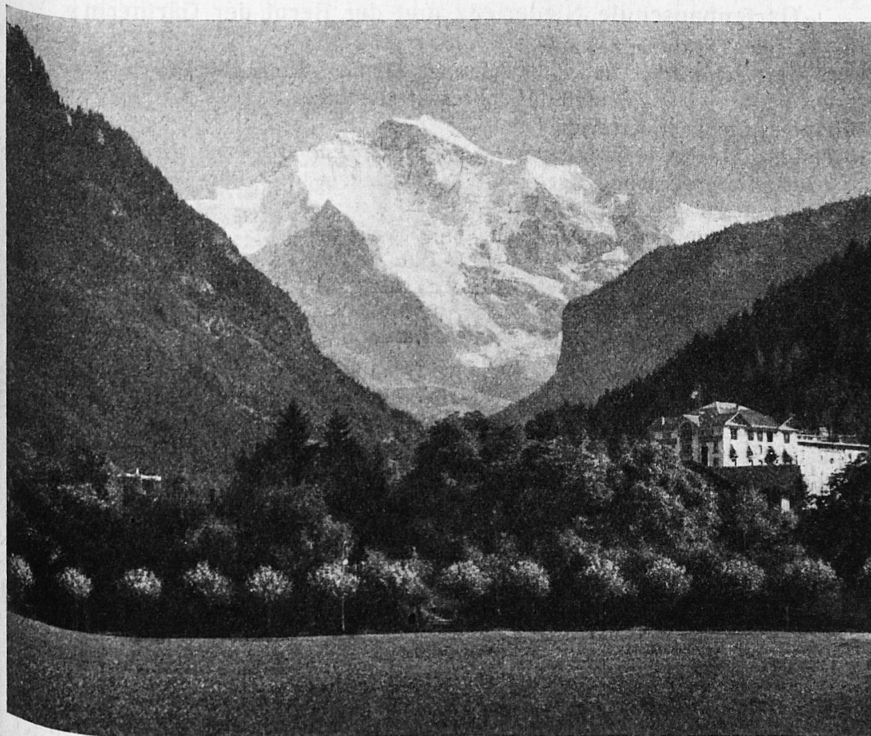
Interlaken mit der Jungfrau