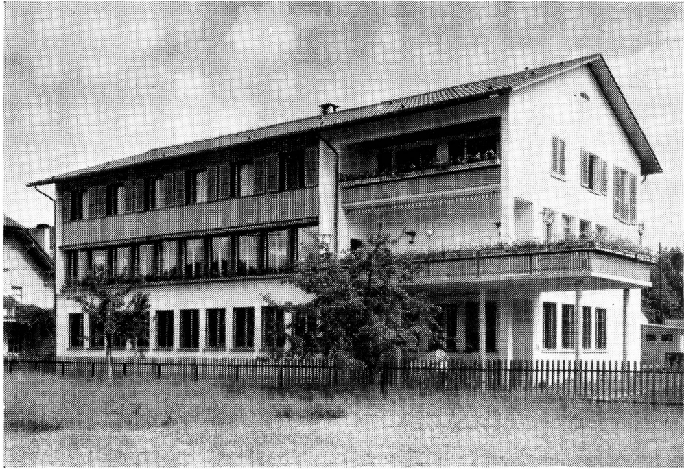
Steffisburg. Der Neubau mit der Gemeindestube