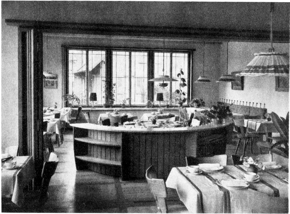
Steffisburg. Die heimelige Gemeindestube.