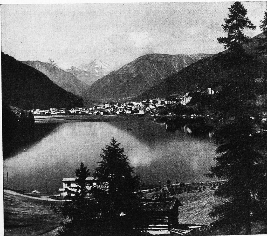
Blick auf Davos